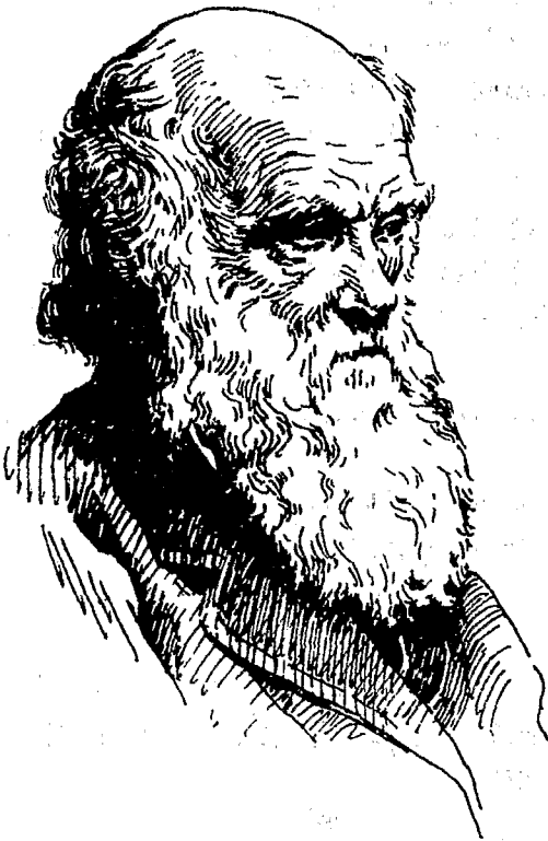
图 1-1 达尔文(1809—1882)(引自《达尔文回忆录》)

所有生物体,从单细胞的变形虫到多细胞的人体都能觉察机体内外环境的变化并产生一定的反应。这种特性叫做应激性(irritability)。动物具有应激性是很明显的,植物是否具有应激性呢?绝大多数植物不像动物那