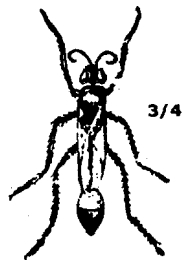
休息的毛刺砂泥蜂

不过我们别在这个敏于应答、爱好嘲弄的士兵身上花太多的笔墨了，还是回到阿尔玛实验室里引起我注意的东西上来吧。几只砂泥蜂用脚搜索着，过一会儿飞一小段路，时而飞到有草的地方，时而飞到不毛之地。这时已接近五月中旬了，一天，风和日暖，我看到它们停在满是灰尘的小路上美滋滋地晒着太阳。这些全是毛刺砂泥蜂。