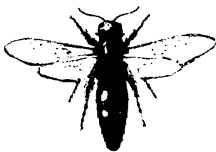
花园土蜂（缩小 \frac{1}{2} 倍）

黑色的身体上长着大块的黄斑，硬邦邦的翅膀像洋葱片那样呈琥珀色，并反射着紫光；粗壮脚爪支节清晰，立着一排排粗糙的短毛；大大的骨架，结实的头，外面套着一层坚硬的头壳；行动笨拙，反应迟钝；飞起来得费上一番力气，无声