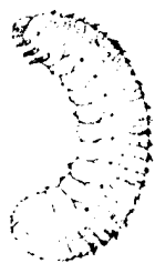
金匠花金龟的 幼虫

第二年八月一到，我便每天察看堆成小山的土堆。到了下午两点钟，当阳光从周围的松树丛中移开照射到土堆上时，在附近刺芹的头状花上饱餐了一顿的雄土蜂就会成群地涌来。它们绕着小土堆，来来回回地不停飞舞。要是有一只雌蜂从土堆里钻出来，看见这一幕的雄蜂就会扑上前。求婚者经过一番不太激烈的争斗决出胜利者后，一对新人便一起飞出院子的高墙。这是我在伊萨尔森林见过的那一幕的翻版。八月过了，雄蜂才会不再出现。母亲从此也不再露面，它在地下辛劳地建立着家庭。