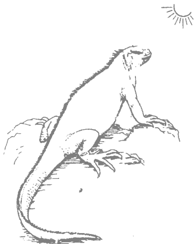
图 1.1 蜥蜴与岩石

表现形式中一种最直观最明显最容易理解的现象之一。如在上述的大气对流层中漂浮有细菌、真菌和植物的孢子；玛丽亚纳海沟（东经 142°11.5′ 北纬 11°20.9′）底部漆黑一片，水压达 1 000 个大气压〔1〕以上。30 年前（1969 年）的 1 月 23 日，美国的“特里斯特号”深海探测器就在洋底发现了繁星点点似的，或有些像箭似的一掠而过的海洋生物。在“斐查兹”海沟底部，探测器实测外壁压力达到 150 000 吨，而周围海底鱼虾类生物却悠然自得的遨游其中。这是空中和洋底的，陆地上的呢？众所周知，通常都是 -70 的南极有企鹅，有地衣有藻类，海水里有鳞虾等等，北极有北极熊等等，地热喷泉边（85℃，有些甚至达 100 以上）也存在一些耐高温菌类