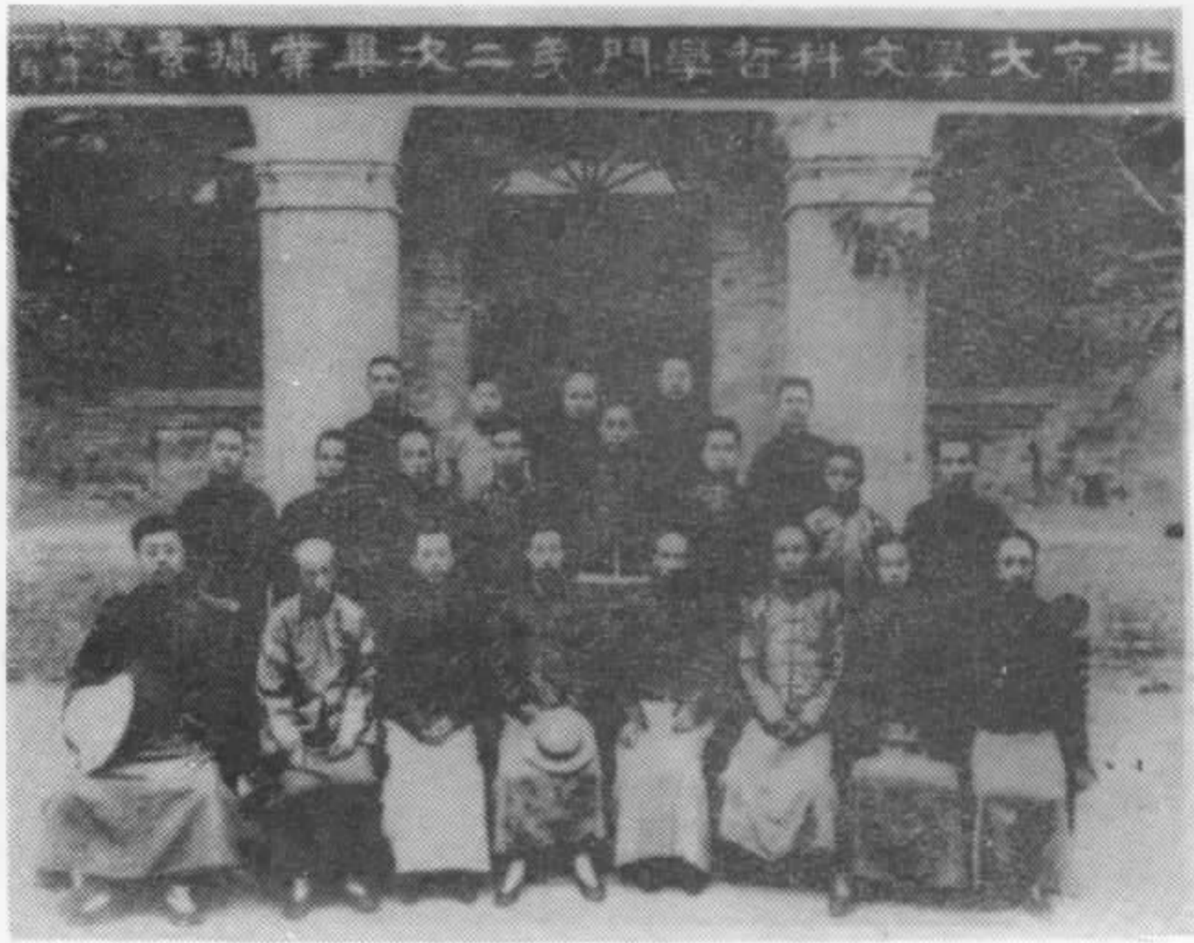
1918年北大哲学系师生合影 前排右二为著者，右三为陈独秀，右四 为蔡元培，中排右五为冯友兰。