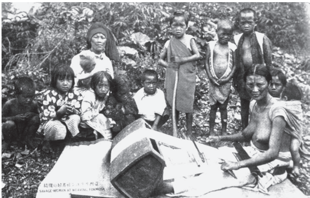
20世纪20年代抚儿织布的台湾高山族妇女

男人或是女人，不管其地位与财富相差几何，他们首先是作为人——一个生物学意义上的人而存在。然而，不同的性别造就了不同的生理结构，而不同的生理结构又多多少少造成两性在其身体素质、心理特征、行为方式上的种种差异。