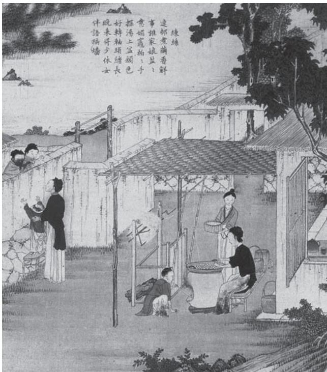
中国古代描绘妇女练丝织绸的版画

进入工业社会以后，男女的性别角色开始有了改变。社会生产的高速发展使工业社会对劳动力的需求空前地增加了。原来对灶临窗、独守空房的妇女开始走出家庭，移步社会，出入工厂，参加劳动。这种情况可能最先发生在下层劳动妇女，尤其是工人阶级妇女的身上。看起来好像妇女已经恢复了她们那久违了的似乎感到有些陌生了的劳动和就业的权利，然而，不应该忘记的是，这一权利的获得却是十分不容易的，妇女为此做出了极