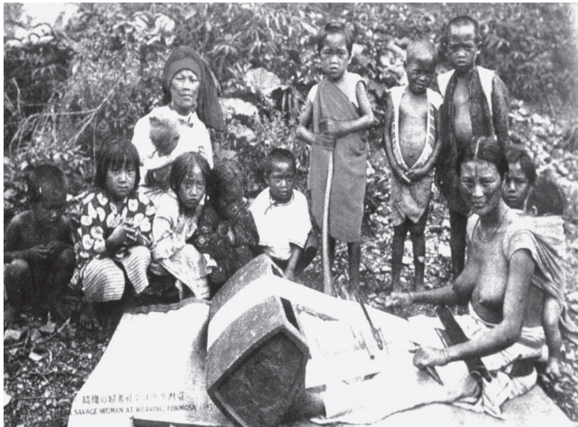
原始社会尼安德特人的生活复原图

我们先来看性别角色。在原始社会中就已经有了性别角色的划分，先是女性在社会生产和生活中扮演主角，她们主要从事果蔬的采集，而这比男性所从事的狩猎和捕鱼更能为氏族提供稳定的食物来源。此时，生产由妇女组织，生活由妇女料理，食物的分配也由妇女说了算。正是由于妇女的经济地位如此之高，相应地，她们的声望和权利也就凌驾于男子之上。