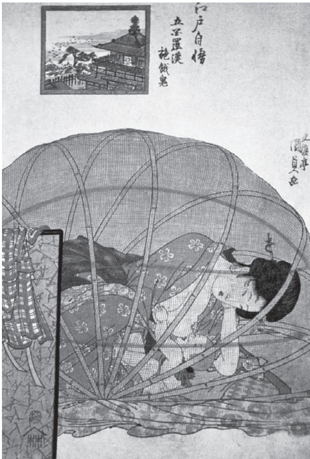
日本浮世绘中描绘的哺乳母亲

再次，男女的行为方式也是各异其趣。首先，女性比男性更具亲和力，她们的人际交往能力自然也略胜一