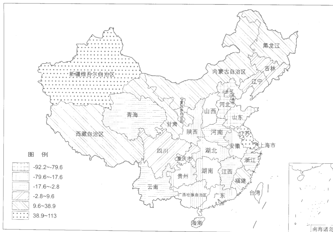
图 0-1 2010 年水土平衡示意图 (方案 II-1)(单位 :亿 m^3 )