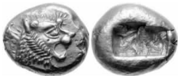
公元前 6 世纪的吕底亚铸币

时间，而下一个重要的步骤——向表征货币的转化——是在此之后很长一段时间才开始的。