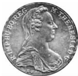
1780年奥地利的玛丽亚·特蕾莎银币 因其上印有玛丽亚·特蕾莎故名

便因此在非洲的阿拉伯游牧民族中广受欢迎——使得它的价值可能要高于其金属物质本身的价值。而国家也会因提供了铸币服务而征收铸造利差。当时便有了代用货币作为小面额货币。损坏或者磨损了的货币仍然可以按其面值流通。但是，有此特征的铸币并不足以构成真正意义上的表征货币。商品货币和表征货币的真正联系可能要在商品货币中才能寻找到。商品货币的供应是受其绝对稀有性而不是