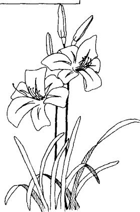
萱草 百合科 多年生宿根草 本植物

3. 养花者要科学地养花 这就需要充分了解花的自然属性，按其规律养花。养花是需要一定的科学知识，养花所采取的措施也应该是按花的自然属性采取合理措施。有些养花者对花卉毫无了解，盲目地随心所欲地照顾花卉，完全不顾花卉的需要。他们会在空闲的时候给花浇水、施肥；没有时间的时候就会忘记浇水。这类养花者不知道花在处于什么期的时候适合施肥，不知道花卉在何时浇水才是科学的。