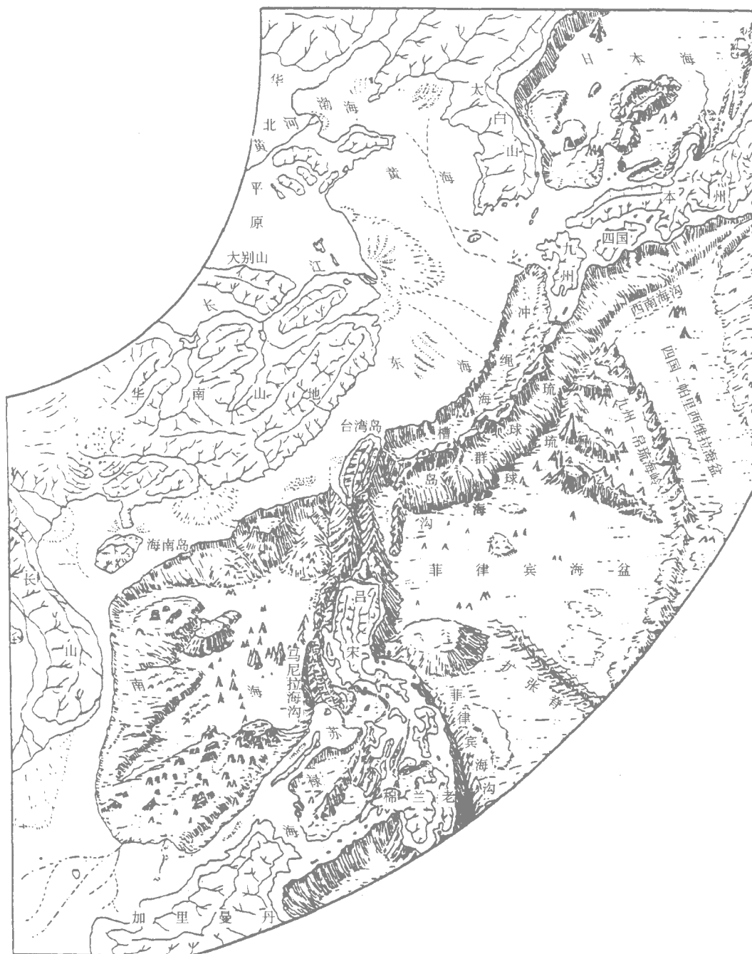
图 2.2 中国近海及邻区地貌略图