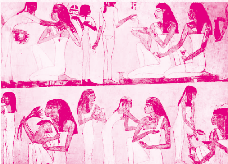
表现古埃及人日常生活的古埃及壁画片段

会对埃及艳后有偏见，将她看做是一个爱勾引男人的风流女王，只因为后人对她的认知全都来自于她的敌人。当前所有有关埃及艳后的认知，全都是来自于她当年的敌人——罗马人。罗马人对她相当轻视，希望将她描绘成一个性感亡国的尤物。世世代代的以讹传讹，谬论也变成了真理。