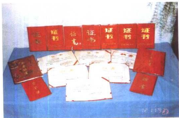
《张家口文史资料》获奖证书