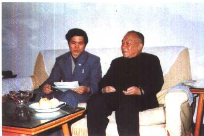
一九八七年五月，原平北军分区政委、原军事 学院政委、全国人大常委会委员程苏权将军在 张市军招听取杨继先关于纪念七七事变五十 周年专辑内容的汇报。