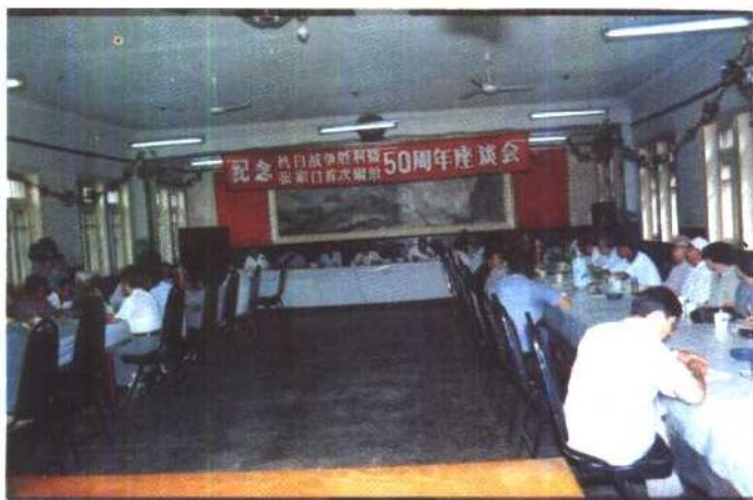
一九九五年八月十日，市政协、市委统战部联合举办座谈会。《抗战时期张家口》在会上首发。