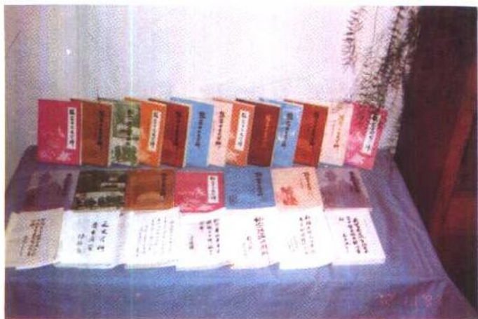
获省、市奖励的文史书刊。