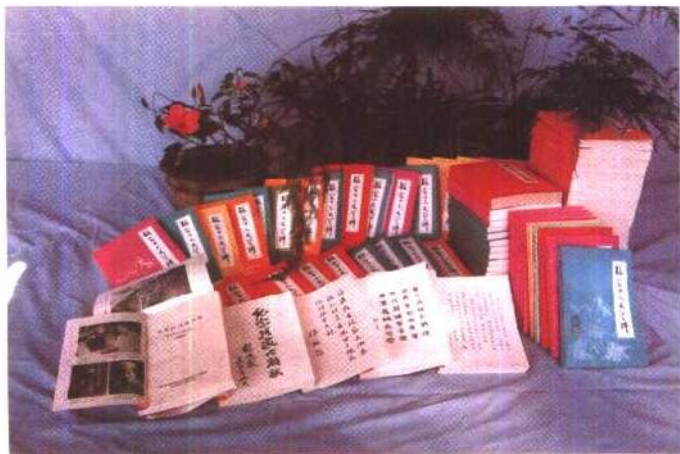
一九八八年，《张家口文史资料》第 一十二辑荣获市科委授予的科技 进步二等奖。