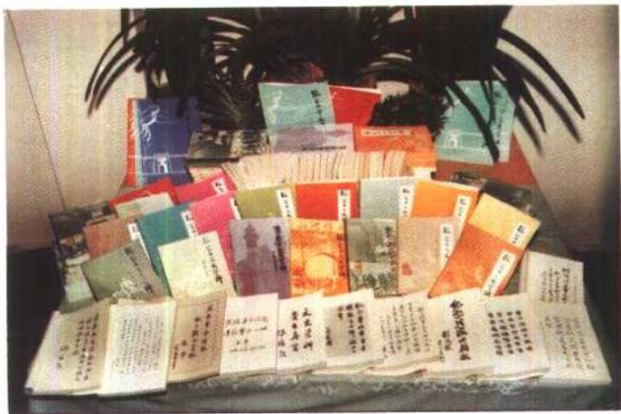
《张家口文史资料》第一——十九辑