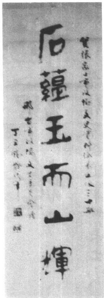
邢台市政协文史委的贺词（张鹤龄先生书）