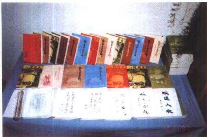
《张家口文史资料》第二十——三十辑