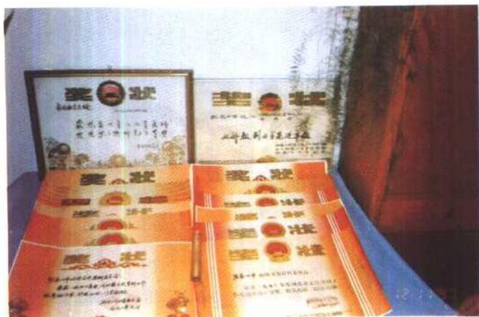
张家口市政协文史处（文史委）获得 省、市奖状。