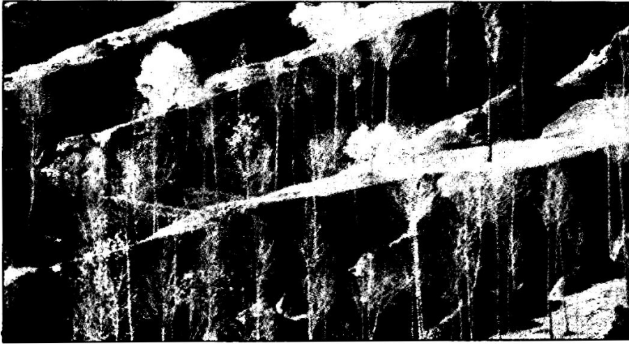
晋东南名山太行山

口为纳 风从西北来 以口为出 终日大风不止 即使在炎热的夏季 也是凉风嗖嗖 尤其是大风顺势旋回 形成呼啸之声 听来似虎啸山林 令人胆战心惊 故称虎风口。