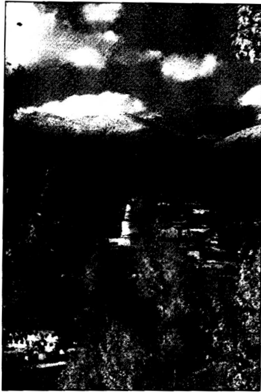
五峰环抱的五台山

五台山现有寺庙 39 座。碧山寺建于北魏，明代成化年间重修，清朝再一次修建。庙分前后两院。前院有天王殿、钟鼓殿、毗卢殿、戒坛殿，后院有藏经阁，左右有经堂、香舍、禅堂、宾中等建筑。各殿内塑像完整，前院建筑多为单层殿堂，后院建筑均为重檐楼阁。