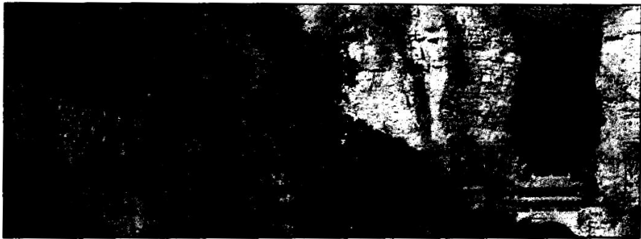
谷幽石奇的苍岩山

公主祠建于金代 到现在有 1000 多年的历史了。原名“妙阳公主真容堂”。相传 隋文帝有小女儿名妙阳 排行第三 人称“三皇姑” 美貌聪慧 招人喜爱。一日妙阳身染风癩 百治不愈 夜梦佛祖相告 河北井陘苍岩山有一神泉，用泉水洗浴可愈。妙阳遂告别父母，来到苍岩山。一日睡梦中目睹帝释天尊发落亡灵 经天尊点化 决定出家。妙阳醒后 不久病愈 遂削发为尼。