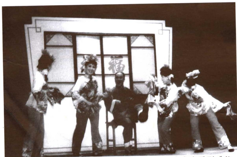
2001年12月15日，由市群艺馆创作的二人台音乐剧《父子争权》，获得国家级“群星奖”金奖。图为该剧剧照。