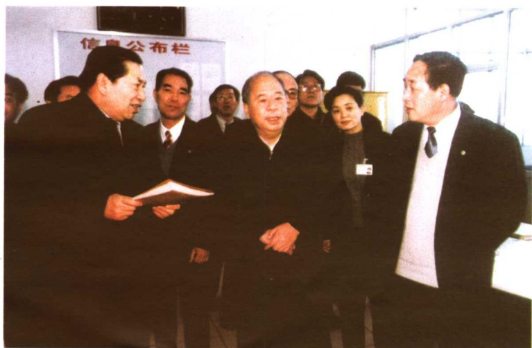
2002年1月31日至2月2日，中共中央政治局常委，中华全国总工会主席尉建行到张家口市慰问困难职工与劳动模范。