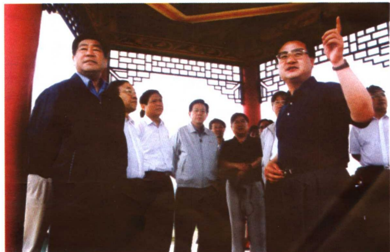
2000年6月17日，中共中央政治局委员，北京市委书记贾庆林到张家口考察。图为贾庆林在省、市领导陪同下在张北考察。