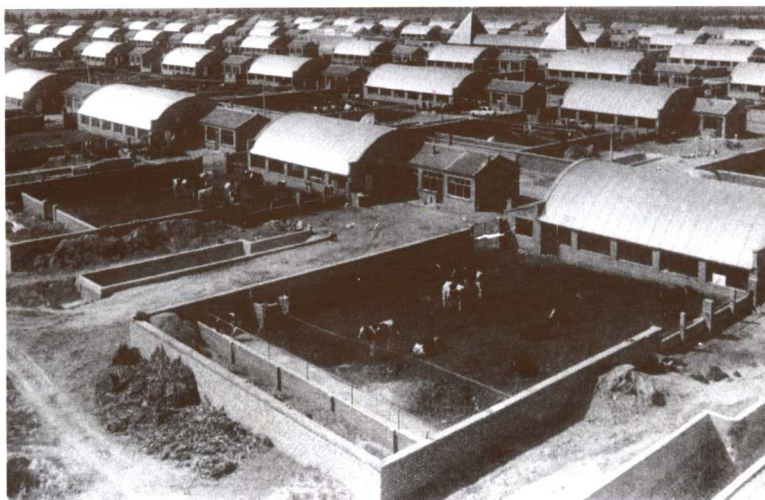
图为察北牧场规模化的奶牛养殖区外景。