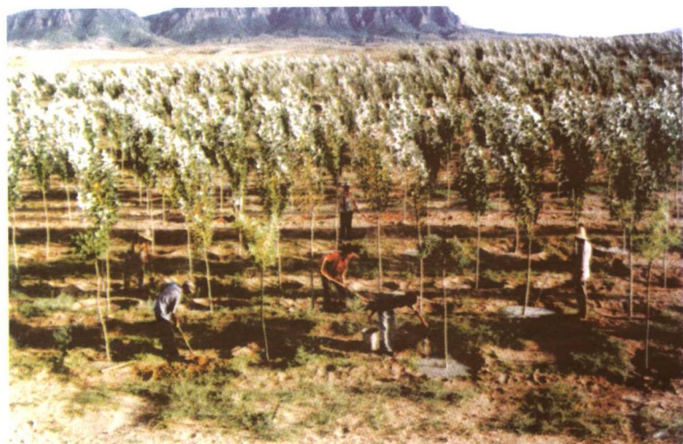
昔日的黄沙滩，已呈现林草茂盛，生机盎然的景象。图为宣化县黄羊滩万亩治沙工程一角。