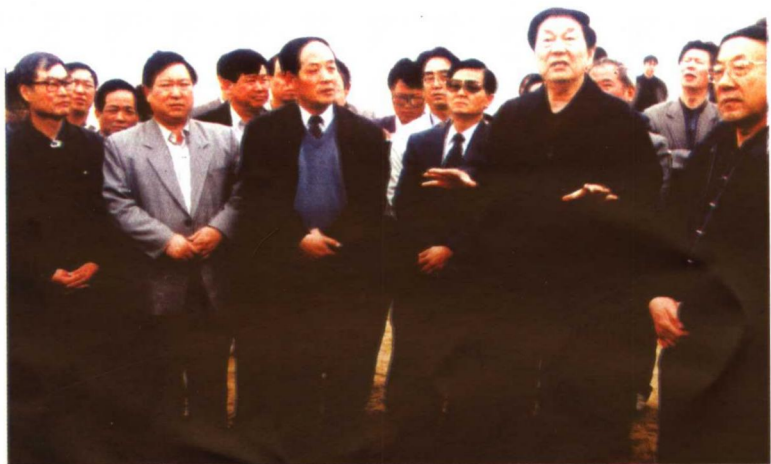
2000年5月13日至14日，中共中央政治局常委、国务院总理朱镕基到张家口市实地考察防沙、治沙情况。图为朱镕基总理在省市领导陪同下，在怀来考察。