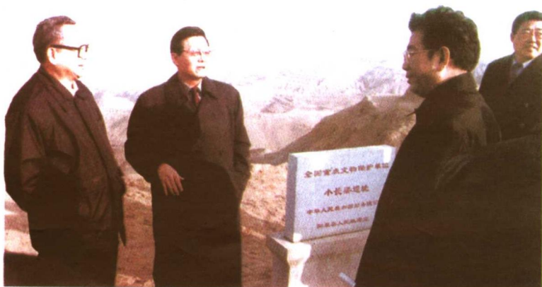
2002年，国务院批准泥河湾为国家级自然保护区。2002年2月初，省长钮茂生专程赴阳原召开省长现场办公会。图为省长钮茂生（中）、副省长何少存（左三）、原省政协副主席郭洪岐（左一）在小长梁遗址考察。