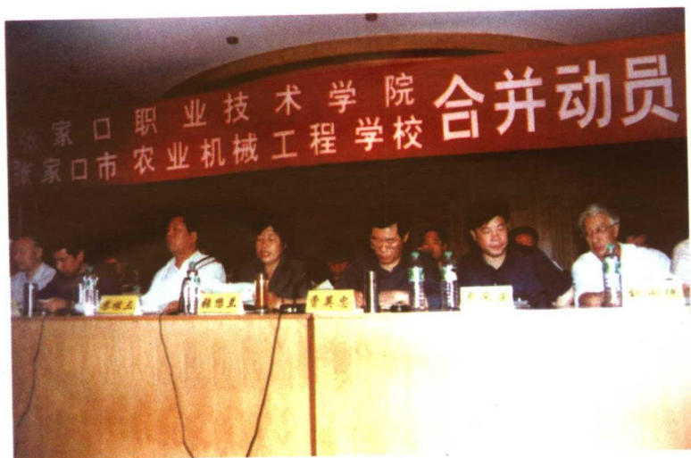
2001年5月25日，张家口职业技术学院同张家口市农业机械工程学校合并，成立新的张家口职业技术学院。图为合并动员大会现场。