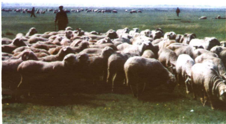
坝上风光，羊儿肥草儿美。