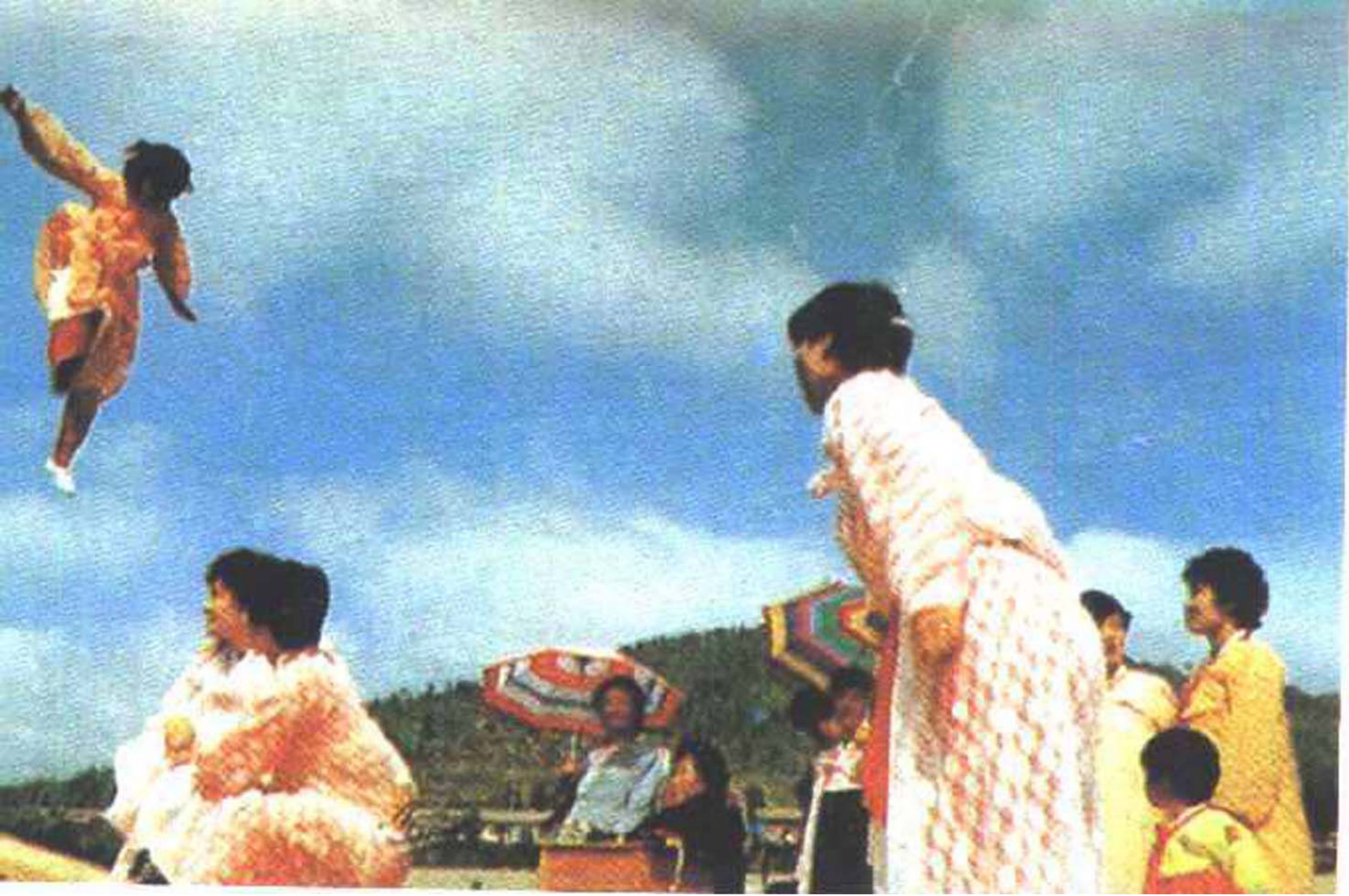
△喜耍跳板过节日(朝鲜族)