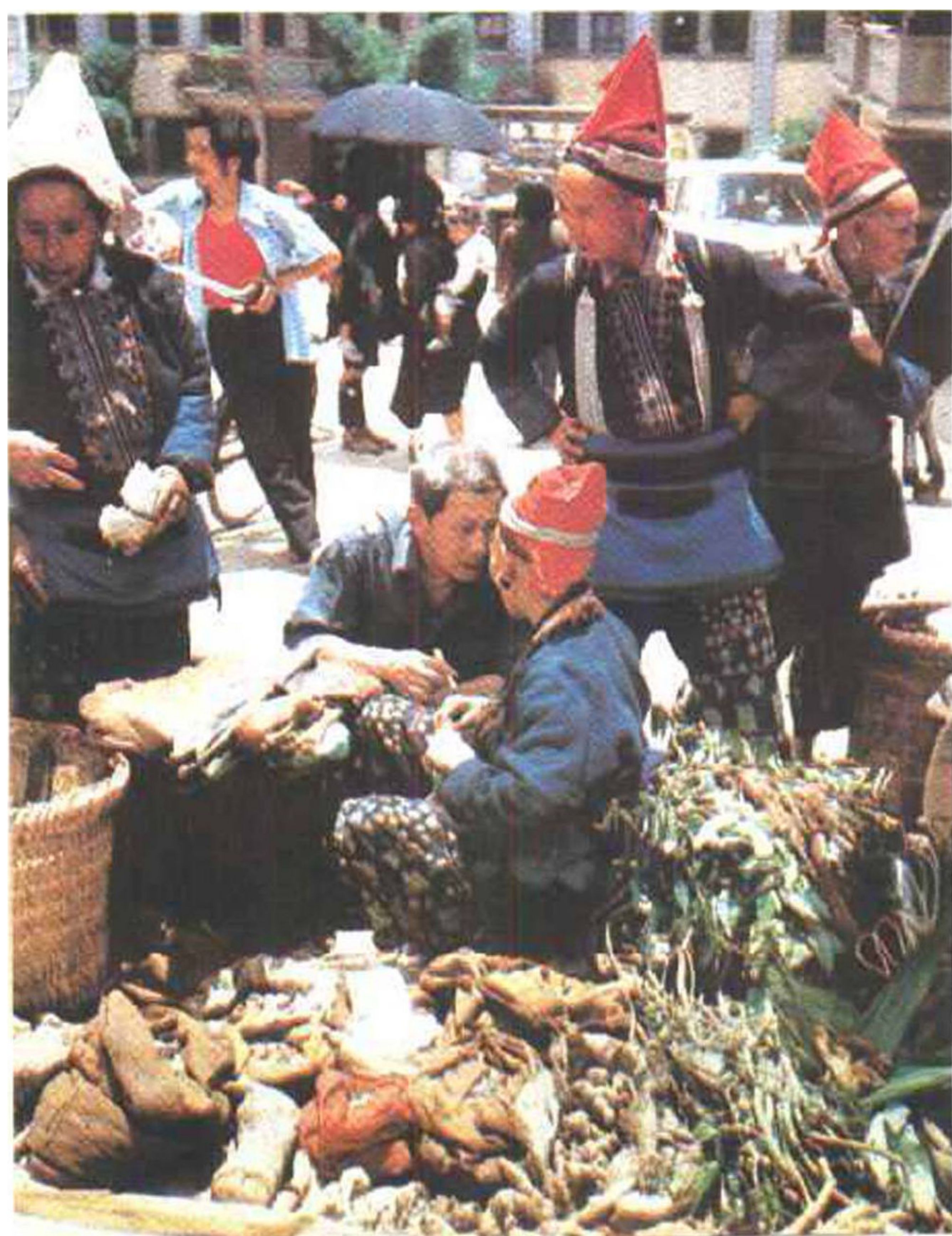
▷ 新年姑娘街 (瑶族)