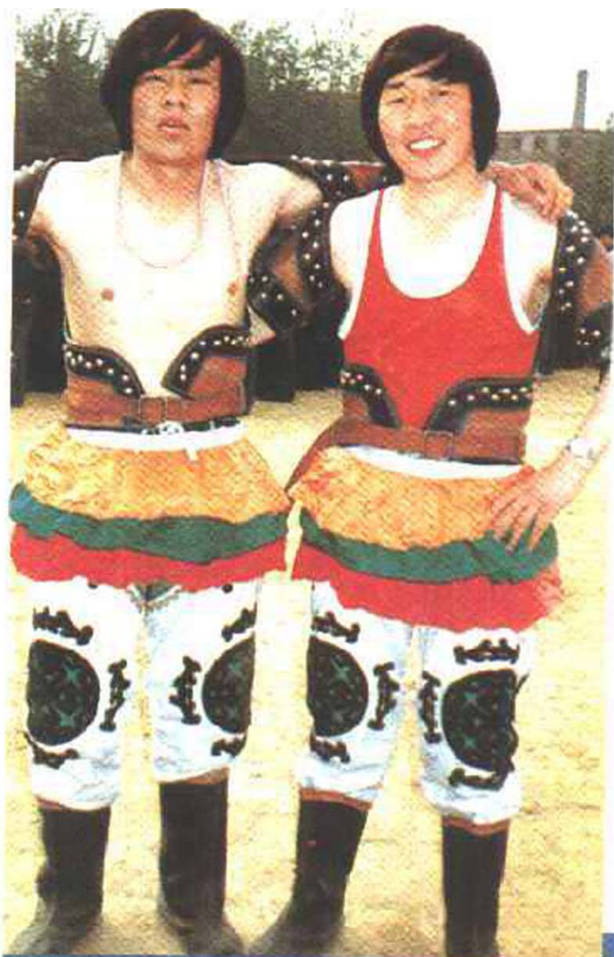
◁那达慕会上的摔跤手(蒙古族)