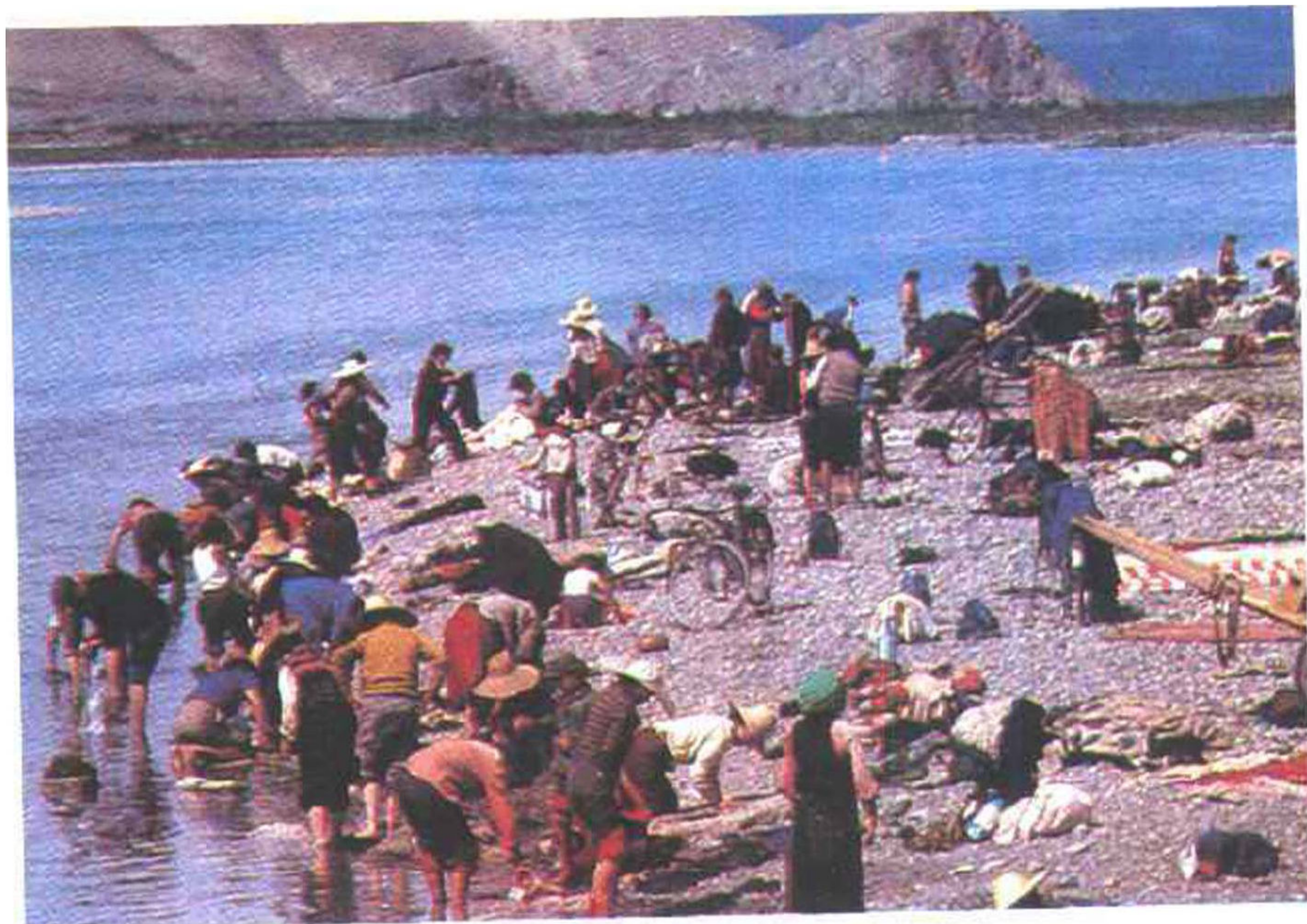
△拉萨河边“沐浴节”(藏族)