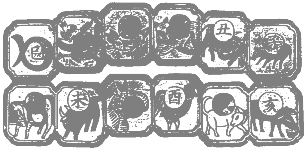
图 4 清代民间年画：十二生肖

蠢笨，每年都要面临被人宰割的命运。故事的叙述之中充满了价值判断和褒贬分明的倾向性，把猪完全当成了抨击讽刺的反面角色。（图 4）