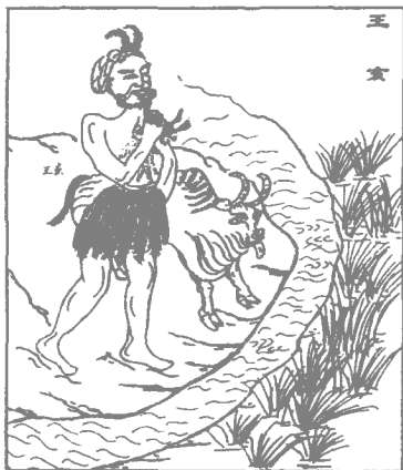
图 2 以“亥”为名的商王王亥

假字。 ① （图 2）在这样的理解之下，亥字作为十二支最末的一个符号，从道理上似乎更明确了。但是亥与豕、猪的关联却变得不大明确了。