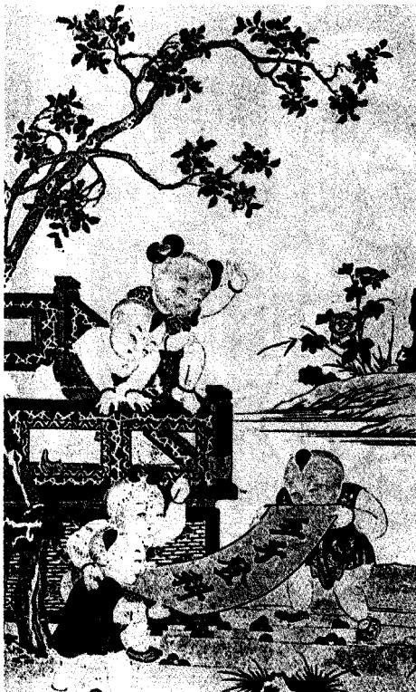
图2 五子登科图（苏州年画）

凡胞胎初下，稳婆率举以两手审视，女也，则以一手覆而置于盆，问：“存否？”曰：“不存。”即坐索水，曳首倒入之，儿有健而跃且啼者，即力捺其首。儿辗转其间甚苦，母氏或汪然泪下。有顷，儿无声，捺之不动，始置起。整衣，索酒食财货，扬长而去。 ①