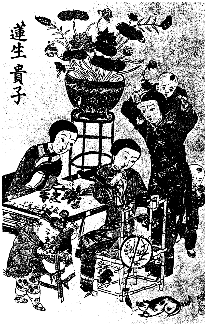
图1 莲生贵子（清代江苏年画）