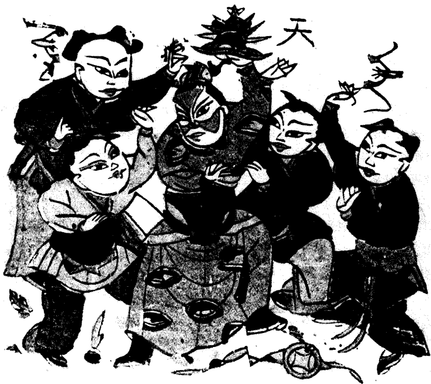
图4 五子夺魁（河南开封年画）