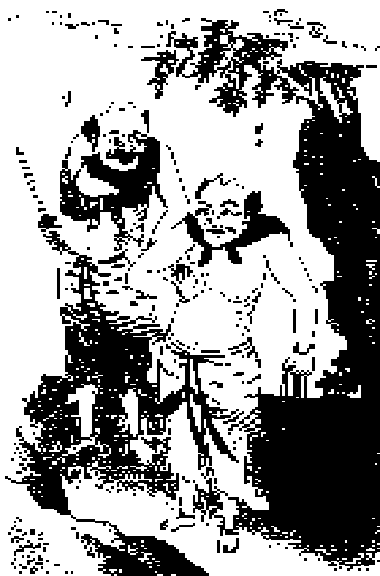
图 1 神荼、郁垒

神荼、郁垒是我国最早的一对门神，其图像在河南密县出土的汉画像石上已可见之。但此前他们是被画在桃木板上，或以其名写在桃木上的。当然，更早仅用桃枝作为神话的象征。桃木被称作“五行之精”或“五木之精”，被当作“压伏邪气、制百鬼”的“仙木”，由于桃树在度朔山处于鬼门之侧，故民间亦用之守门镇宅。《艺文类聚》卷八十六引《庄子》说：“插桃枝于户，连灰其下，童子入不畏，而鬼畏之，是鬼智不如童子也。”可见，以桃木守门户的风俗在春秋时代即已形成，但最初并无图像或文字的附缀。