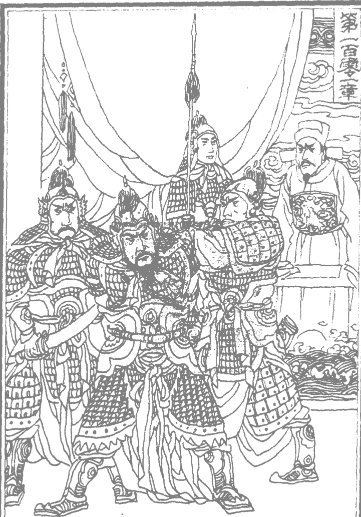
袁崇煥受巫陷被杀