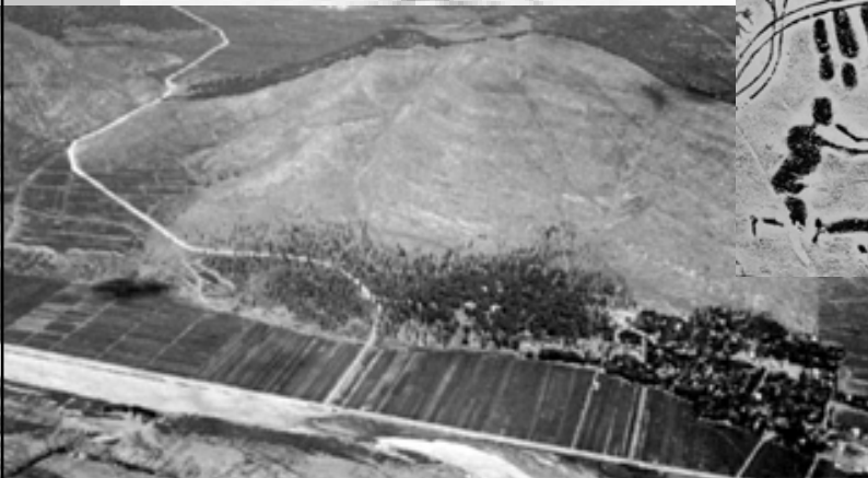
尼山 据传孔子父母在此野合， 孕而生孔子，故给孔子取 名“丘”，字“仲尼”。