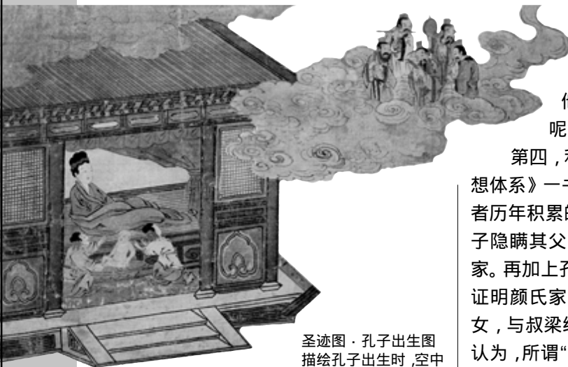
圣迹图·孔子出生图 描绘孔子出生时，空中 祥云缭绕众神送子。

如果不在出生问题上故弄玄虚，使之与凡人不同，以尊其为神，孔子就不能成为“圣人”，他的观点主张又怎能为世人信奉呢？