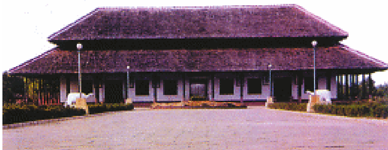
殷墟遗址复原图(约公元前1300年,商把首都迁到这里,一直到商朝灭亡。武王伐纣后,宫殿就成了废墟。)

商朝后期政治混乱,最后一个王是纣(Zhòu)王。他只知道自己享乐,根本不管人民的死活,是个残暴的君主。