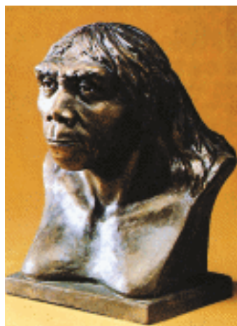
北京人头部复原图