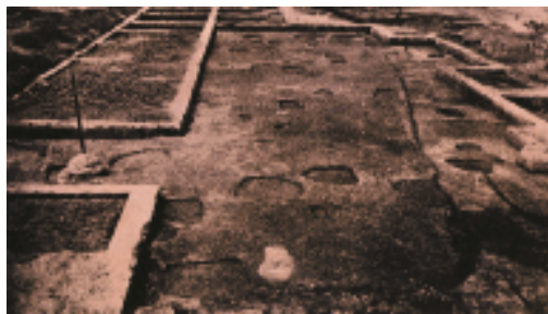
二里头夏朝宫殿遗址

夏朝历经400多年，最后一个王叫桀(jié)，他是个暴君，统治非常腐朽。那时黄河下游的商国强大起来，起兵灭夏，大约在公元前1600年建立了商朝。