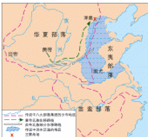
黄帝和禹传说时期地域示意图