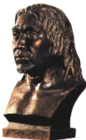
山顶洞人头部复原图

中国是世界文明古国，也是人类的发源地之一。中国到目前为止是世界上发现旧石器时代的人类化石和文化遗址最多的国家，其中重要的有元谋人、蓝田人、北京人、山顶洞人等。