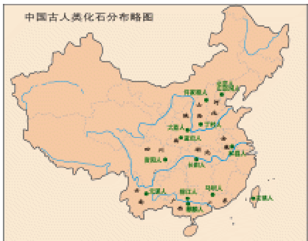
中国古人类化石分布略图