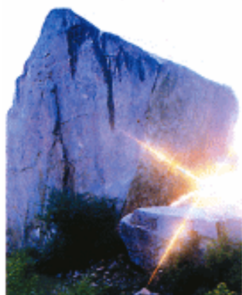
启母石 (在河南登封，传说大禹的妻子生了启之后，天天在这里盼望大禹回来，后来就变成了石头。)