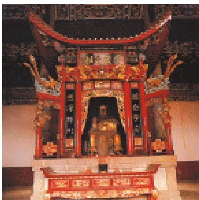
炎帝陵内的炎帝像(传说炎帝死后葬在湖南的白鹿原)

华夏族是汉族的前身，是中华民族的主要组成部分。华夏族把黄帝、炎帝看做自己的祖先，称自己为“炎黄子孙”。直到今天，汉族人和许多兄弟民族还习惯这么说。