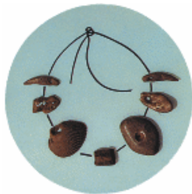
山顶洞人装饰品复原图

山顶洞人按母亲的血缘关系组成氏族。同一氏族的成员居住在一起，共同劳动，共同分配食物。