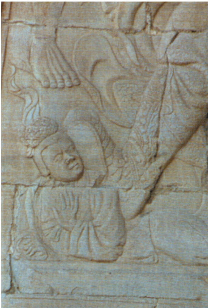
天王脚踏汉族妇女像 元

这是保存在北京昌平区居庸关云台上的雕塑，实际是元朝时期汉族备受各级政府欺压的真实反映。