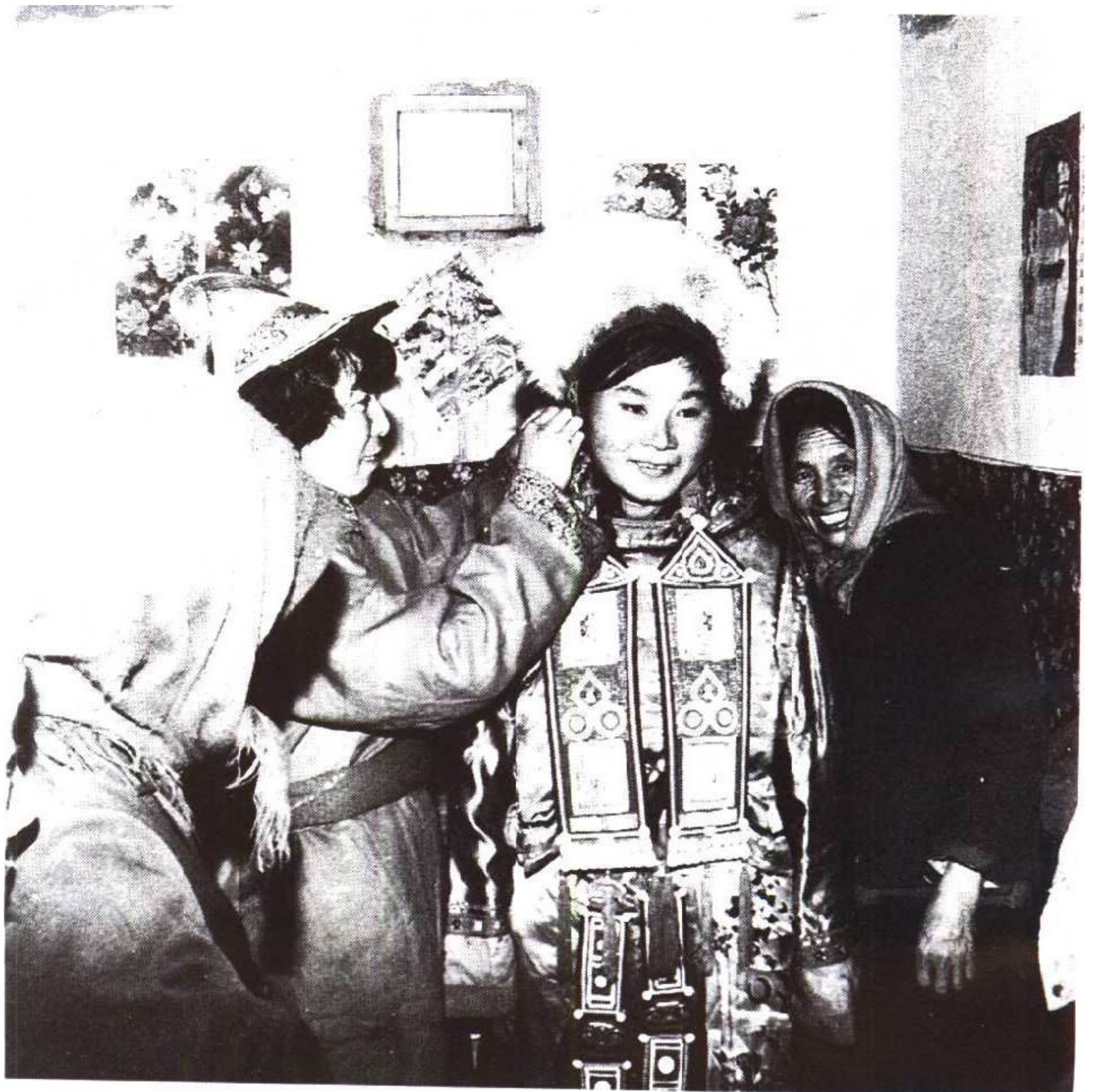
裕固族婚礼戴头面