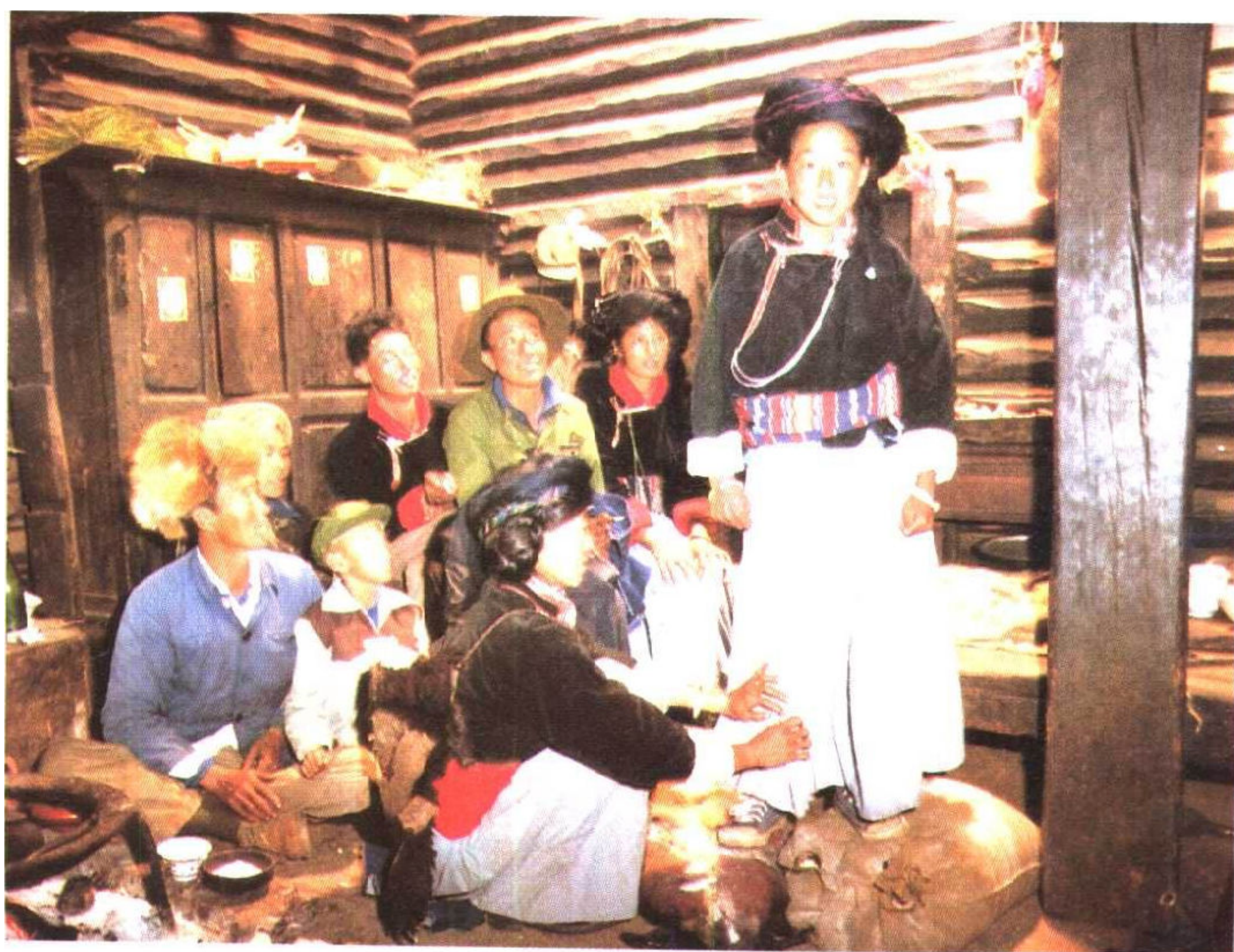
此为试读, 需要完整PDF请访问: www.51wendang.com 摩梭少女十三岁穿裙子 (成年礼)