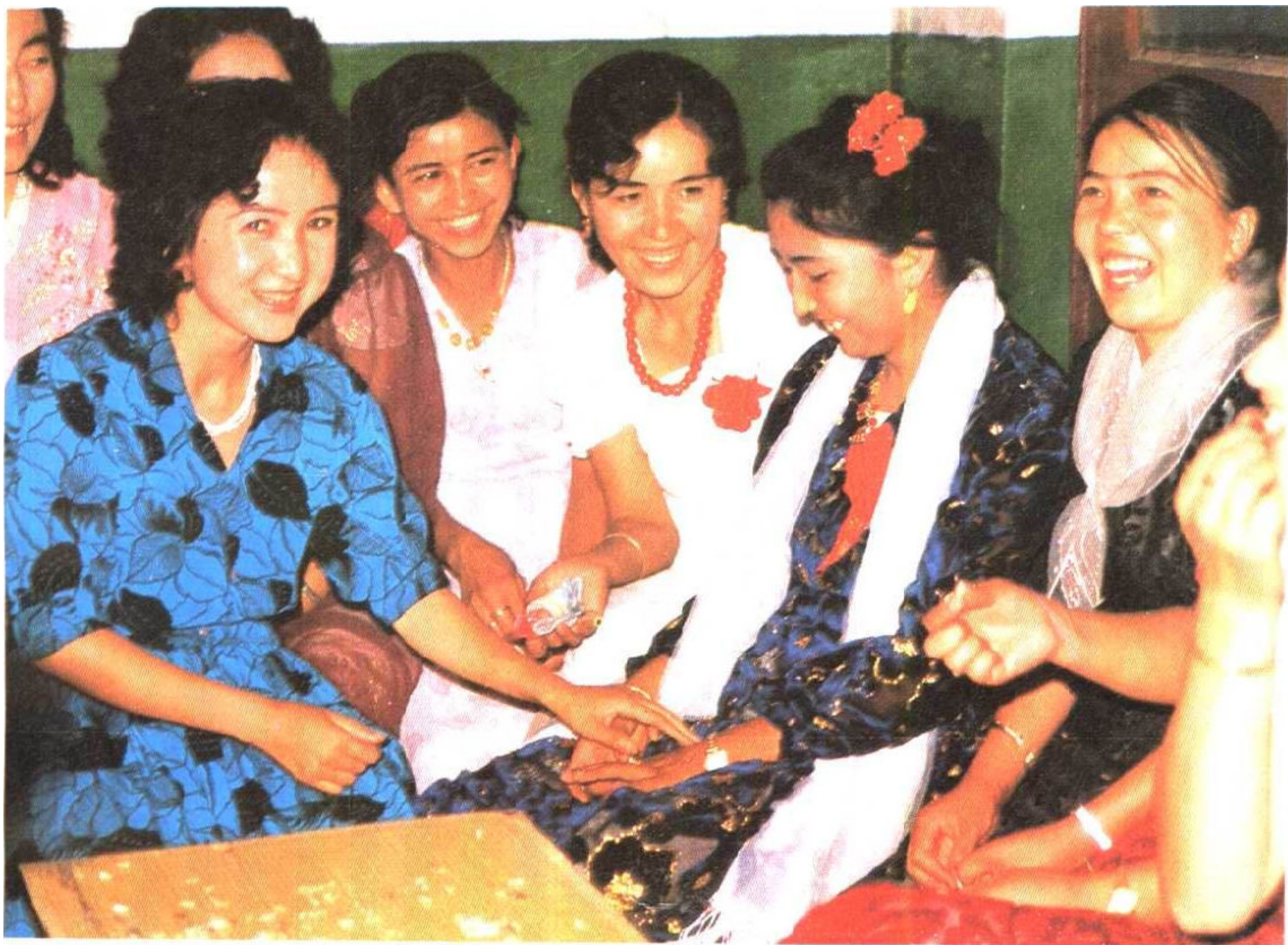
维吾尔族的正婚日——新娘与女伴话别