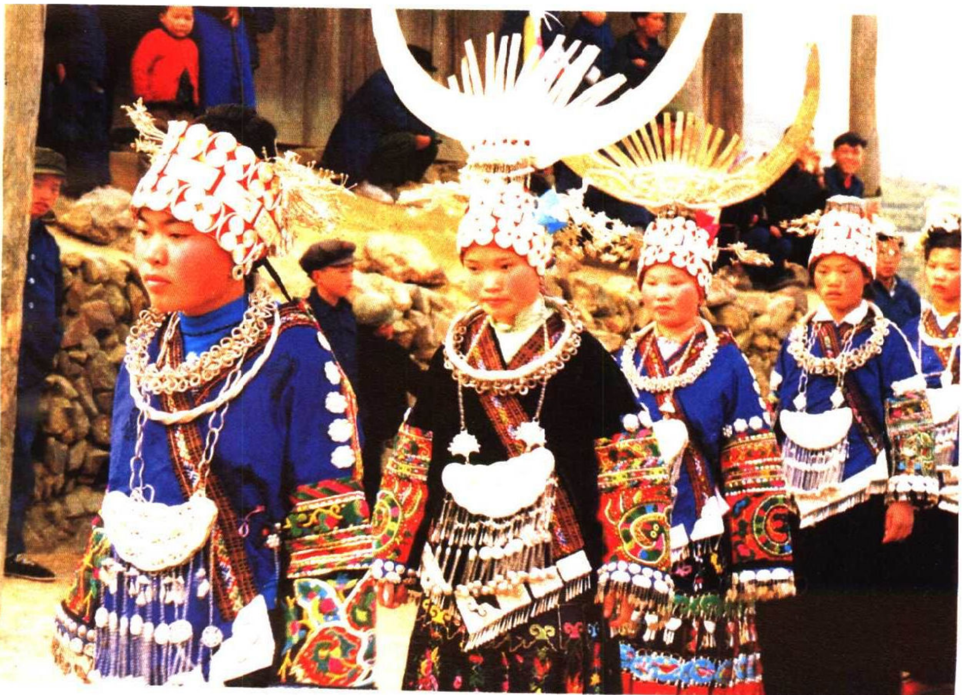
贵州苗族姑娘在芦笙场上