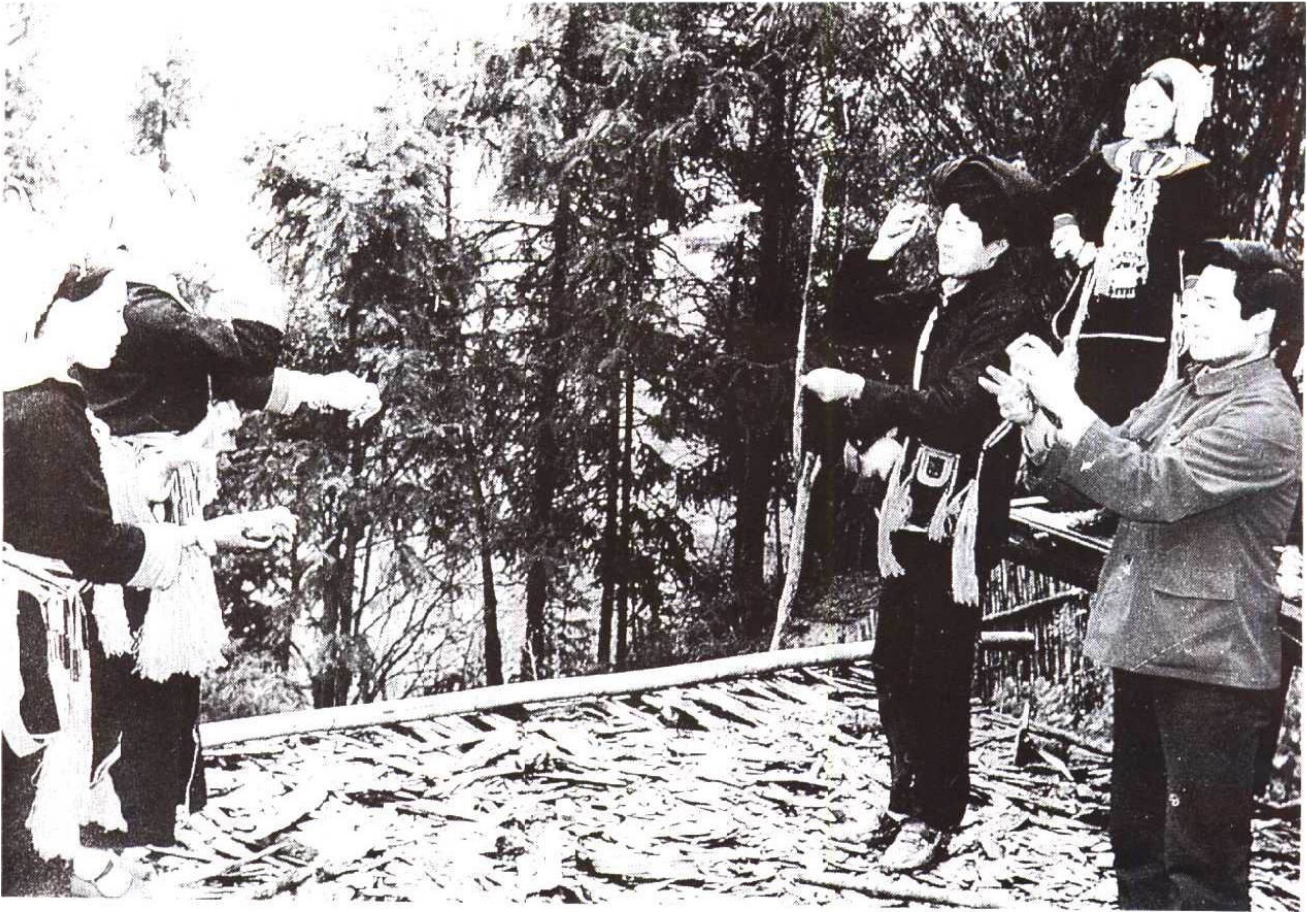
云南瑶族“丢包”游戏