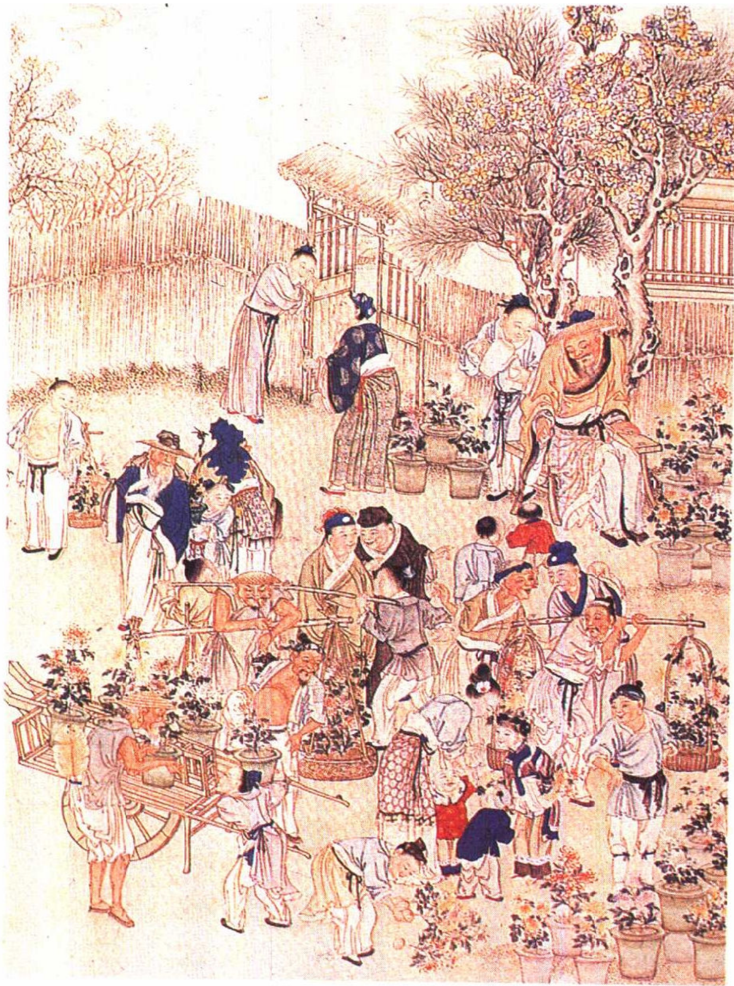
花市选自《中国古文明大图集》