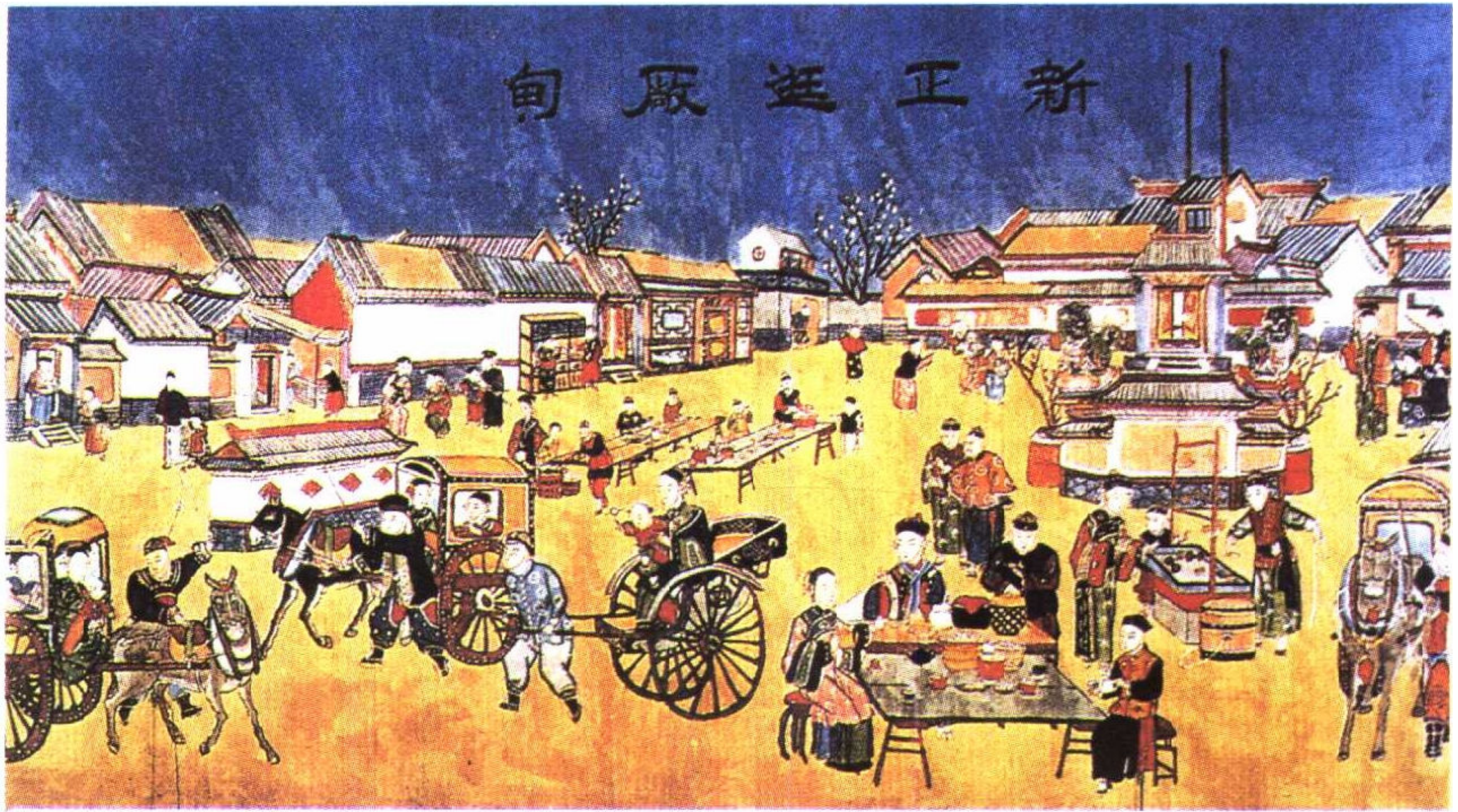
清代庙会集市