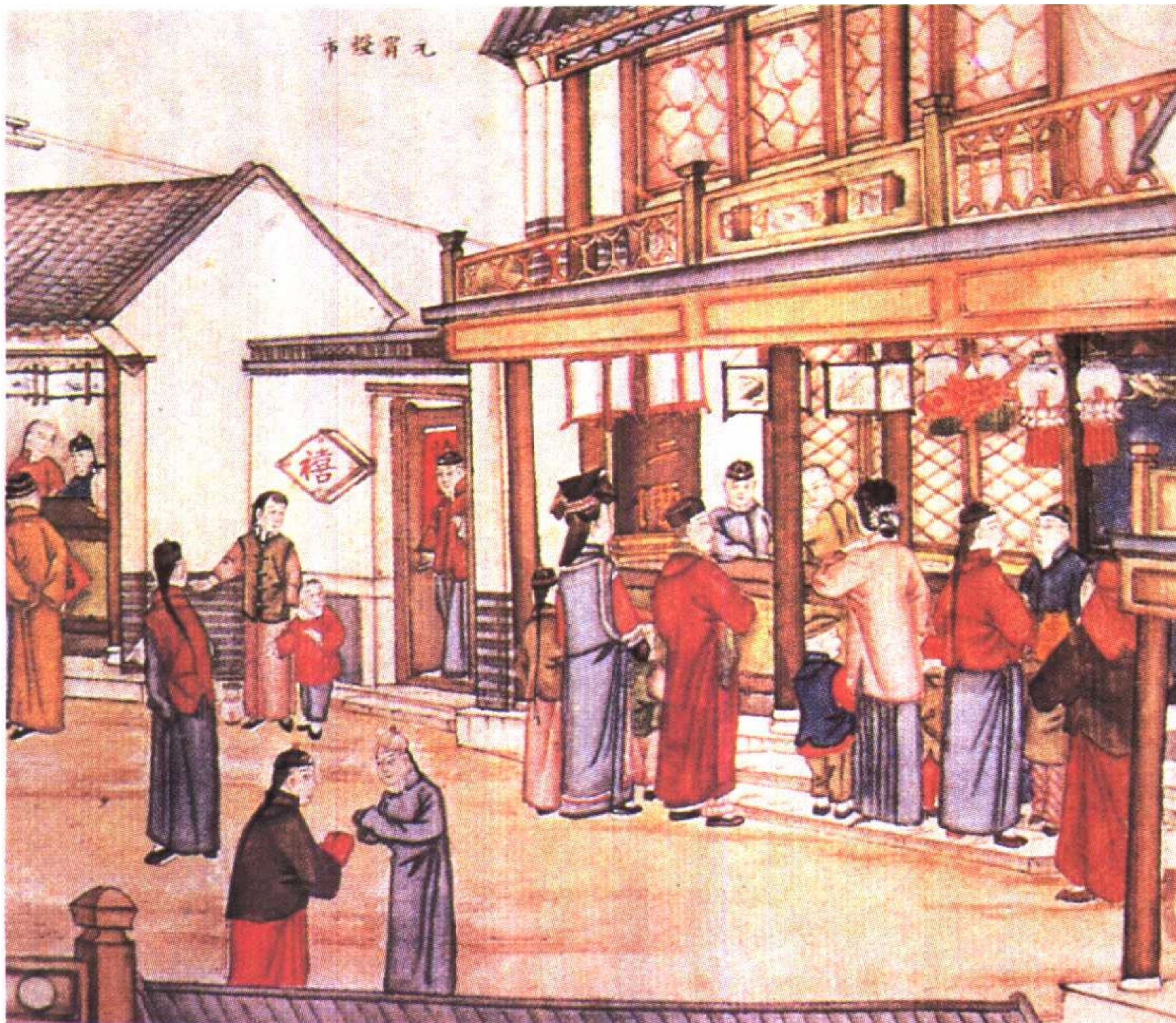
元宵灯市