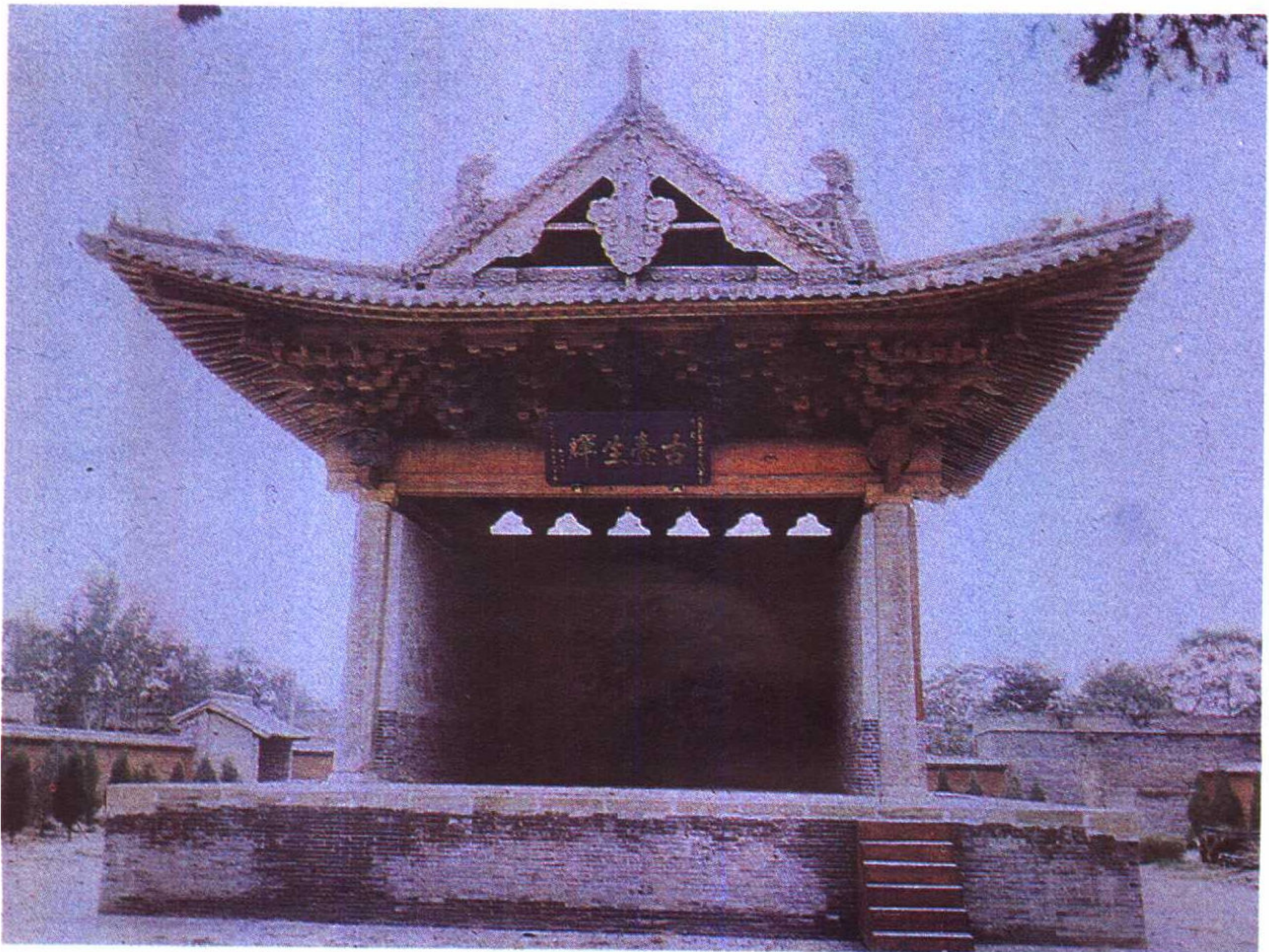
临汾市东羊村东岳庙元代戏台正面 选自《宋元戏曲文物与民俗》