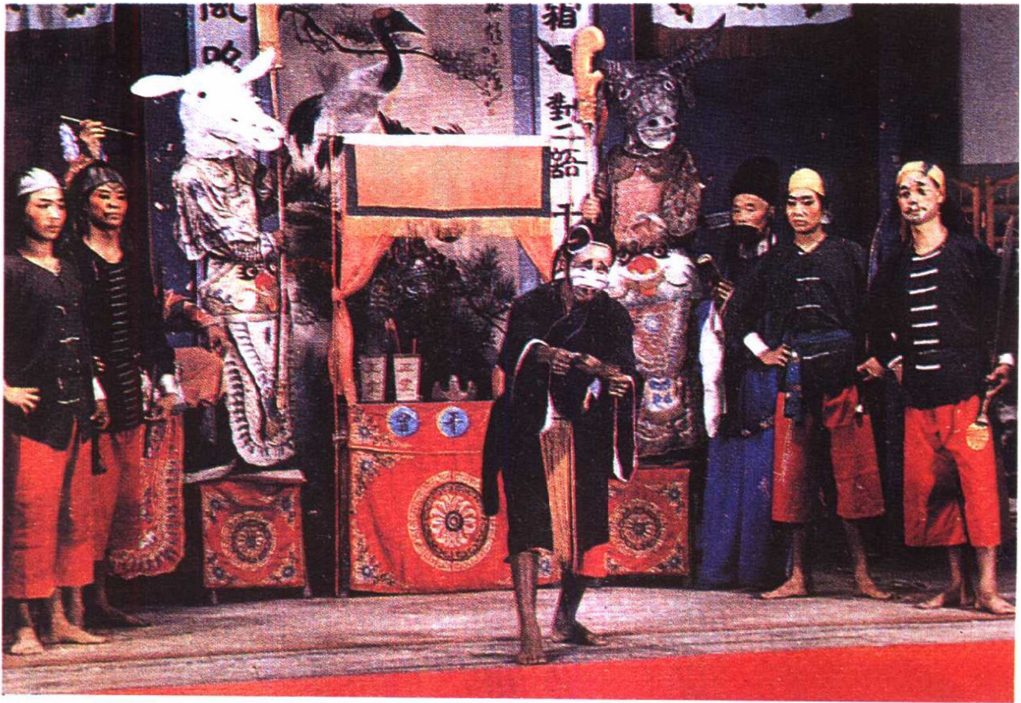
浙江上虞哑目连中阎王发牌票