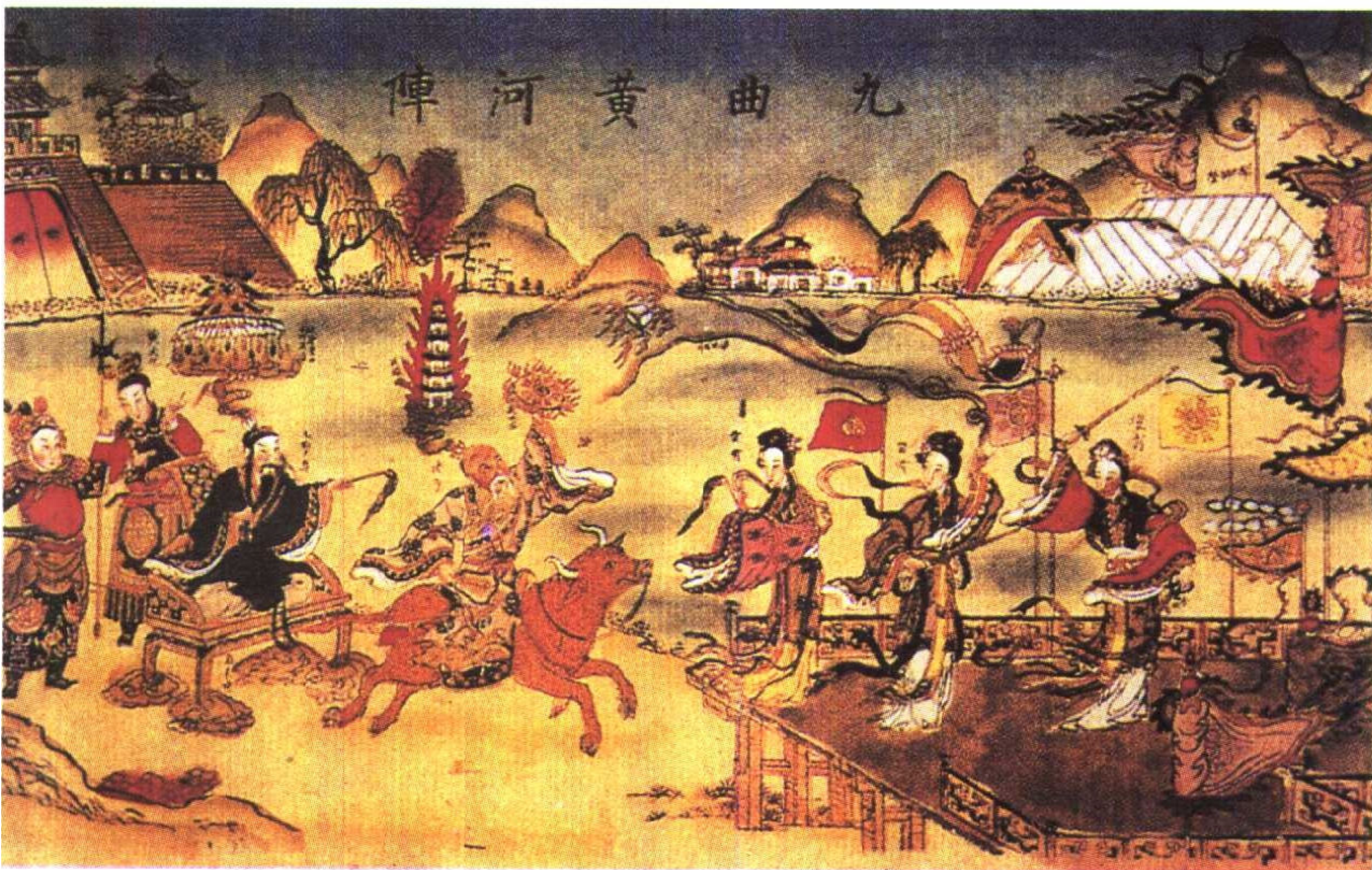
九曲黄河阵 选自《中国古文明大图集》第七部 P185