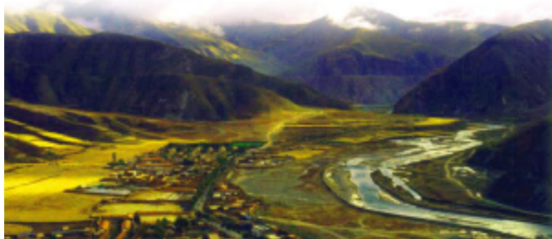
河畔的村庄，在寂静里透着祥和