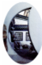
江苏扬州何园内 某门墙装饰