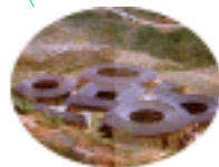
福建漳州 某村土楼群俯瞰