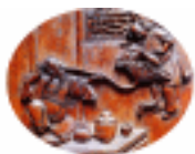
安徽黟县际联乡 某宅门扇木雕《仙饮图》