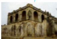
广东梅县大浦乡 百侯村某宅