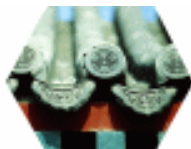
北京宣武区某宅 檐口装饰