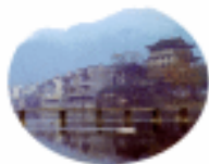
湖南凤凰县城 关民宅群