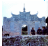
贵州从江县侗族 民间神庙祖母堂