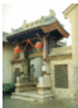
山西襄汾丁村民居牌坊