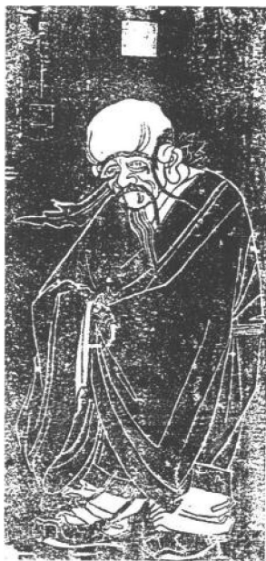
明代绘刻的寿星图

这个传说，虽不足为据，但给春节的来历增添了一层神秘的色彩。由此，中华民族的传统节日，在浓厚的神话色彩中拉开了帷幕。