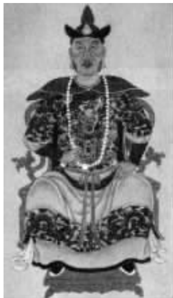
清太祖努尔哈赤像