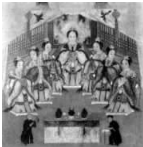
清宫廷画家绘满洲始创女神《佛库伦像》

三十五年( 猓 )乌拉部所属东海瓦尔喀部归附努尔哈赤,努尔哈赤派其弟舒尔哈齐赤迎接其首领家眷,布沾泰率兵于图门江之乌碣岩截获。努尔哈赤大破之,斩首 猓 获马 猓 ,甲 猓 副。乌拉大衰,辉发部被灭。四十一年( 猓 )灭了乌拉。