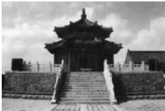
近年复建的赫图阿拉城汗王殿