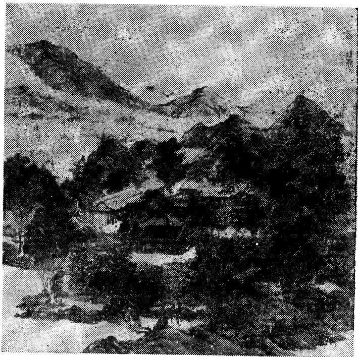
镂月开云（原是牡丹台）

湖，湖光林影，花木芳菲，风景优美。园里的建筑也很精美，后湖东南角有一处叫“牡丹台”，是圆明园有名的第一个景观。在汉白玉的台基上，建起一座宫殿。这座宫殿所用的木料，全是香楠木，木纹和颜色都保持着原状，看上去特别自然、清爽、雅致。殿顶的琉璃瓦，有蓝色的，有朱黄色的，两种颜色拼出一幅美丽的图案，在阳光照耀下，真是金碧辉煌，美妙无比。殿前的台地上，栽种着几百棵品种名贵的牡丹，初夏盛开，大朵大朵的牡丹花，迎风招展，雍容华