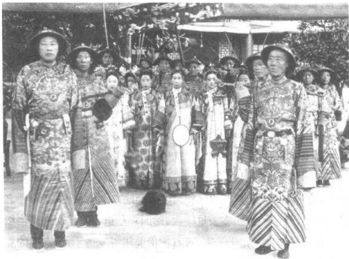
图4 慈禧与太监及后妃等在颐和园

的那些古宫。当然，伊的主意一经决定之后，便等于是已经实行的一样了。立刻就有电报打到奉天去 知照那里的人 准备一切。虽然那边的宫院也象热河行宫一般的常年有人看守着，可是在太后未启程以前，北京方面又另派了许多人去，目的是要把那几座久已空闭着的宫殿 点缀得象紫禁城和颐和园一般的华贵舒适(图4)