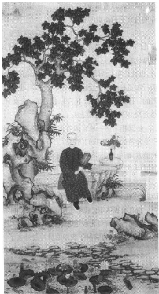
图3 咸丰帝便装行乐图