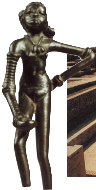
摩亨佐·达罗的舞者