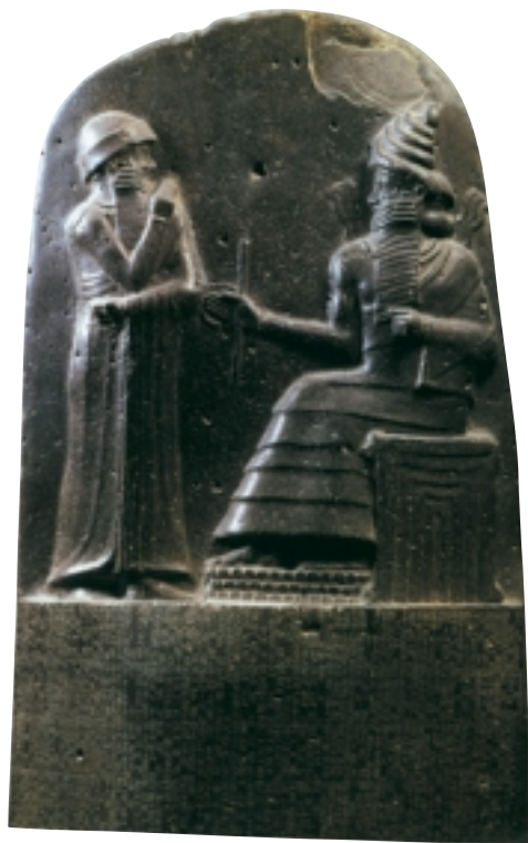
汉谟拉比法典碑 公元前18世纪