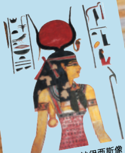
生命与健康之神伊西斯像