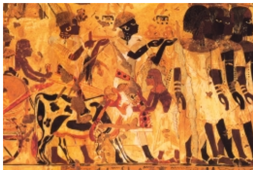
骑牛车的努比亚公主

一位努比亚公主乘坐由两头牛拉的战车,她的随从捧着金指环、豹皮以及其他礼物,将其敬献给古埃及第十八王朝法老图坦卡门。