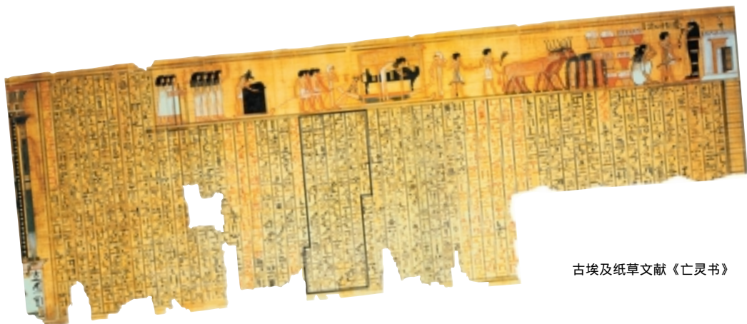
古埃及纸草文献《亡灵书》

之间没有任何粘接物,而是把一块石头直接放在另一块石头上,拼合得天衣无缝,甚至连最薄的刀片也插不进去。砌工之精确,内部结构之复杂,实在令人惊叹不已。同时,由于金字塔造型独特,凌厉的风势不得不沿着塔的斜面或棱角上升,塔的受风面由下而上越来越小,在塔顶,塔的受风面趋近于零,这种以柔克刚的独特造型,把风的破坏力降到最小程度。这就使金字塔虽然历经数千年的风吹雨打,却依然屹立在埃及大地上。