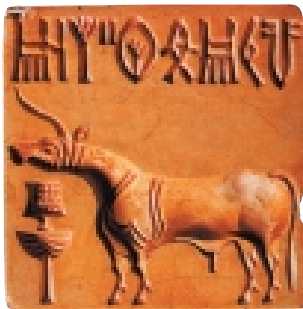
古印度印章 哈拉巴文明 在哈拉巴发现的数千枚小方印章中，大多由皂石制成，上面刻有动物图像，包括独角兽、公牛、水牛和虎，还刻有文字，但这些文字至今未被释读。