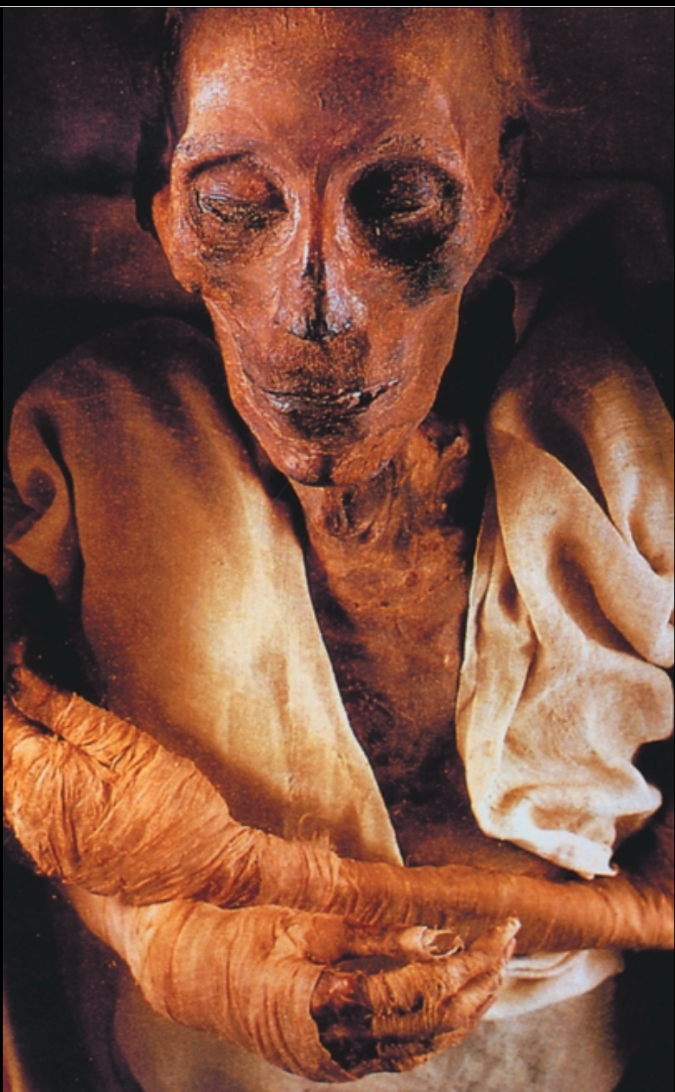
拉美西斯二世法老木乃伊