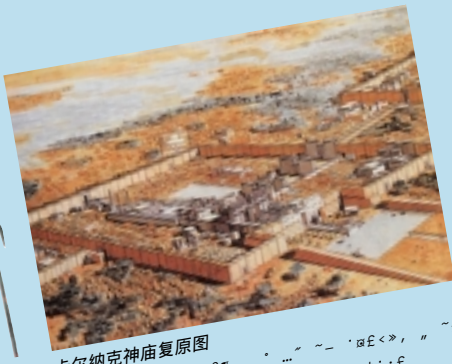
卡尔纳克神庙复原图

法老权力的至高无上，塔尖代表法老。这不言而喻向被统治者昭示：法老是太阳神之子，法老的权力来源于太阳神。