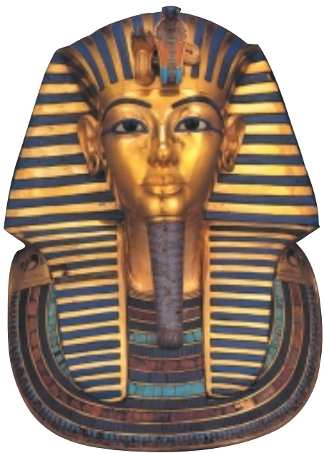
图坦卡蒙法老的黄金面具

GUAIJIWENMIGUDECHEJIAN 时间：公元前 3300 年 关键词：象形文字 木乃伊 金字塔