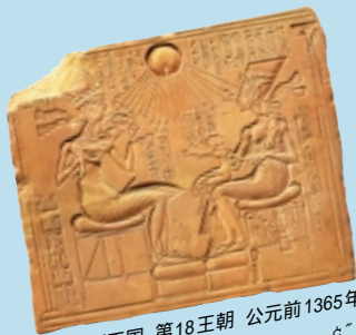
浮雕 新王国 第18王朝 公元前1365年