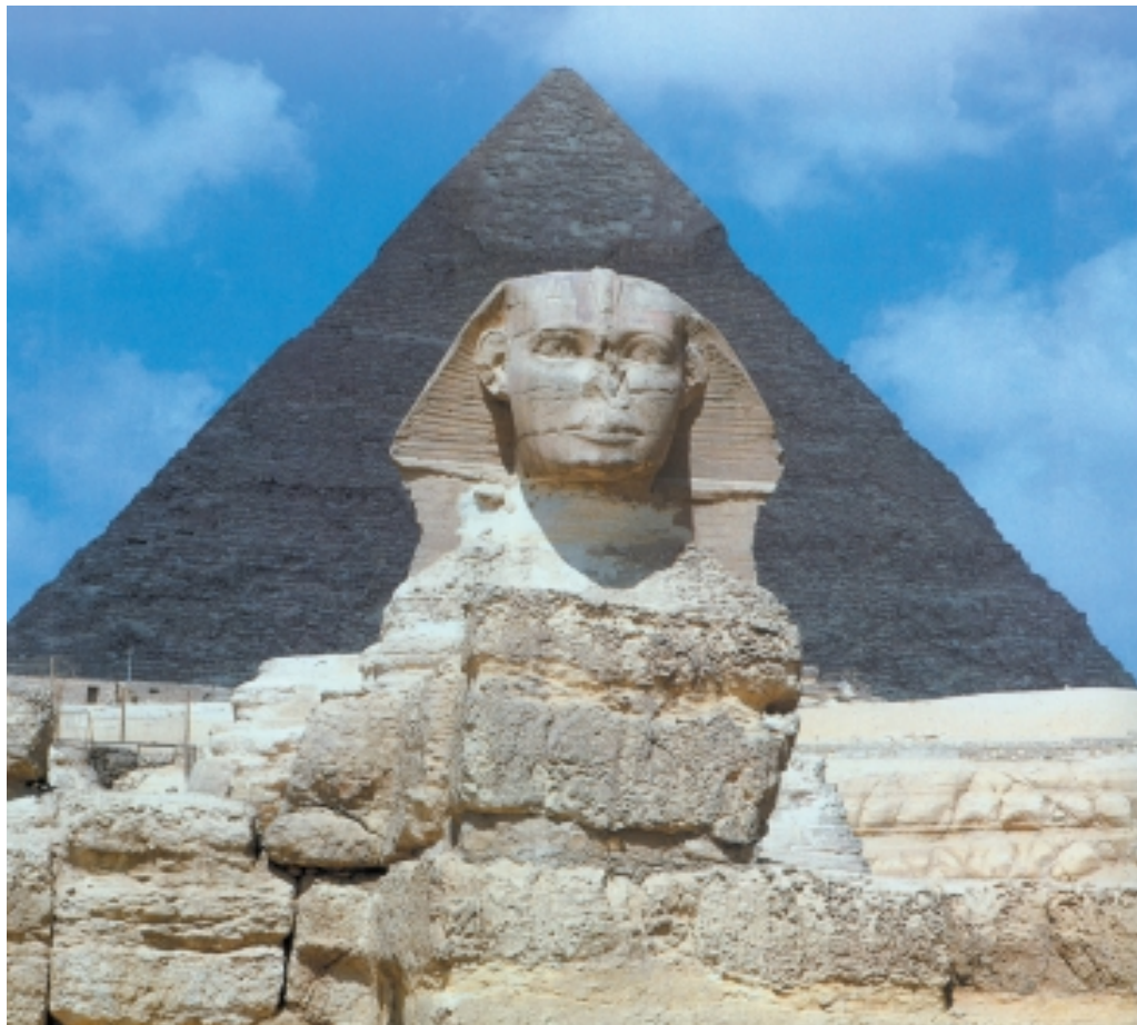
哈夫拉金字塔及狮身人面像