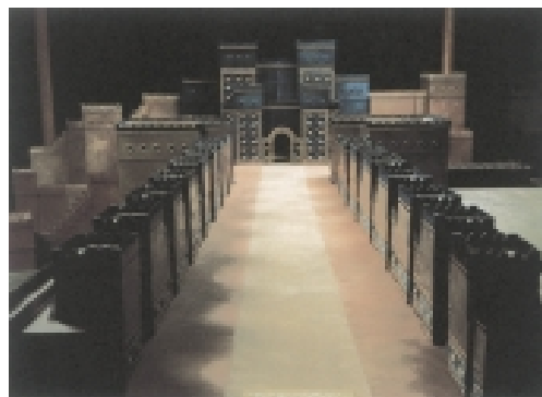
巴比伦大道及伊什塔尔城门复原图