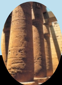
卡尔纳克神庙中庭的第2塔门 新王国 第19王朝 公元前1250年

金字塔与太阳神是紧密联系的。金字塔的每一面都被打磨得非常光滑。大金字塔，即胡夫金字塔，它巨大的石灰石表面被砍凿得非常精细，石块之间甚至连刀片都插不进去。这样，金字塔就可以最大程度地反射阳光。金字塔塔尖更是终日处在阳光照耀之下。金字塔结构体现了埃及