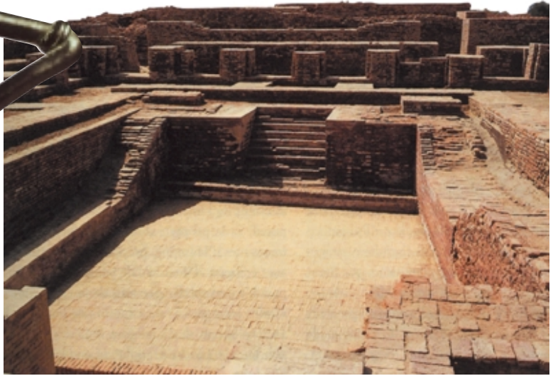
摩亨佐·达罗古城遗址

度人已经掌握了对金银等金属的加工技术。从出土的各种美妙绝伦的手工艺品和奢侈品中,可见当时工匠的精巧技艺。制陶和纺织是哈拉巴文化的两个重要部门,染缸的发现表明当时已掌握纺织品染色的技术,纺织业与车船制造业等也高度发达。城市的繁荣使哈拉巴的商业盛极一时,不仅国内贸易活跃,国际贸易也特别频繁。大量古迹遗址的发掘充分证明了它与伊朗、中亚、两河流域、阿富汗,甚至缅甸和中国都有贸易往来。