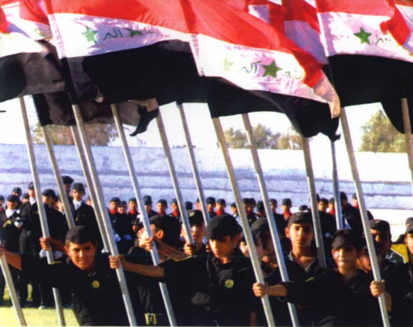
伊拉克儿童军和娘子军。