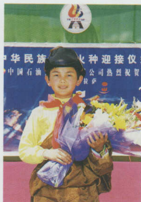
节庆活动中的藏族儿童。

青藏地区刚形成时，喜马拉雅山和青藏高原还不高，海拔1000多米，气候湿润炎热，属热带森林和草原景观。近300万年以来，青藏高原快速隆起，直到目前海拔4700米。但每个地质时期隆起的速度并不均匀，在距今200万年的早更新世时期，平均隆起了1000多米，在距今100万年前的中更新世时期又上升了1000米，但从晚更新世以来的仅10万余年，上升量为1500米，平均每年升高1公厘以上。特别是距今1万年前起，高原的上升速度更快，它以每年7公分的速度上升了约700米。