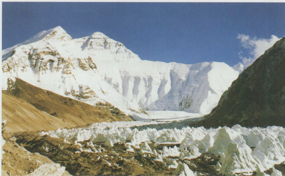
位于中国的西藏自治区定日县和尼泊尔边境的喜马拉雅山脉主峰珠穆朗玛峰海拔 8848.13 米，为世界第一高峰。