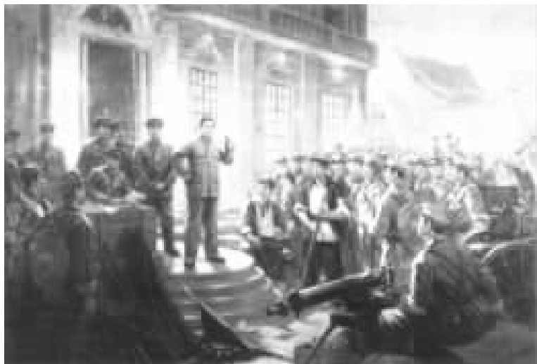
八一南昌起义（油画）