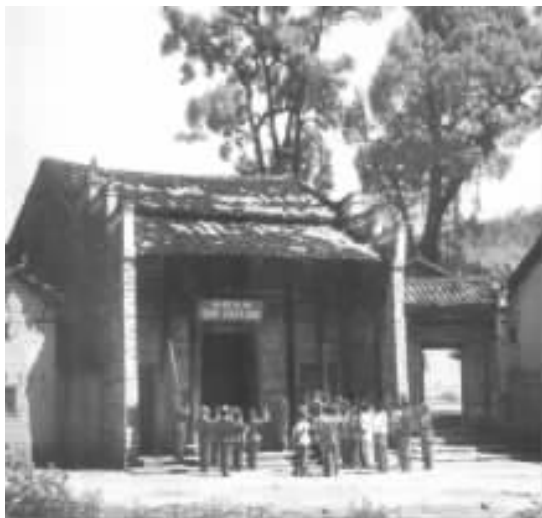
湘赣边界党的第一次代表大会会址