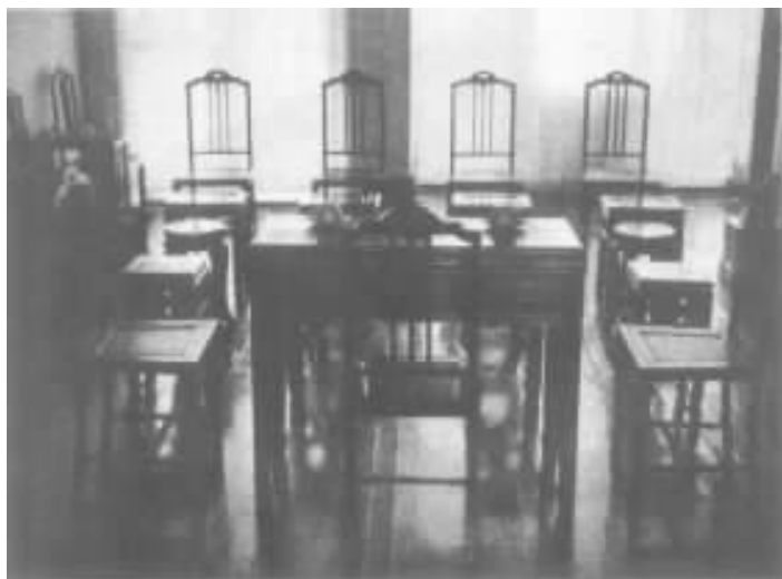
汉口鄱阳路 15 号二楼——八七会议旧址