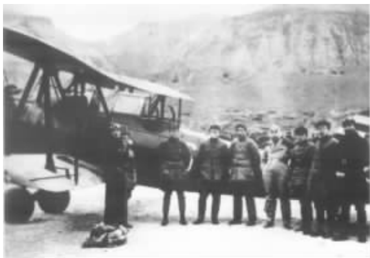
员斌车源月在延安机场接周恩来