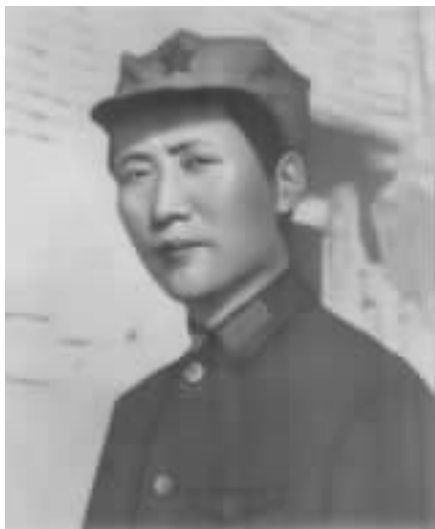
毛泽东在井冈山时期