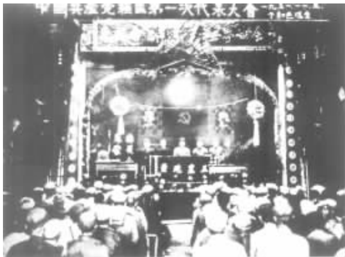
中华苏维埃第一次全国代表大会会场