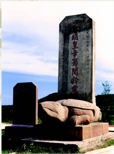
唐明皇幸蜀闻铃处

然而杨国忠妒忌守关老将哥舒翰，生怕哥舒翰立了大功，自己的相位不保，就谎报军情，让唐玄宗逼迫哥舒翰出战。哥舒翰明知出关不可能战胜强大的叛军，但是没办法违抗玄宗的旨意，痛哭一场之后，只好带兵出战。唐军在灵宝与叛军崔乾祐相遇，唐军在山谷中中了埋伏，被叛军杀得大败，20