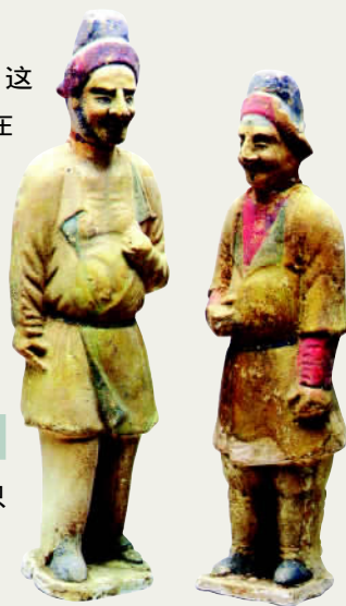
唐墓出土的阿拉伯人俑

高仙芝答应了对方的请求，但在见到车施鼻后，却又临时变卦，将车施鼻押送长安，斩首示众。这种背信弃义的行为激怒了西域各国，他