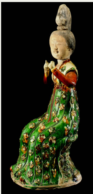
三彩梳妆女坐俑 唐

此为中晚唐之际的贵族礼服，主要分为宽袖对襟衫、长裙、披帛3个部分。一般多在重要场合穿着。穿着这种礼服，发上还簪有金翠花钿，所以又称“钿钗礼衣”。