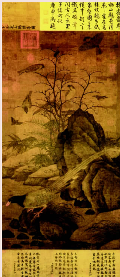
黄居冢·山鹧棘雀图轴 此画为北宋画院画家黄居冢所作。所绘野水坡石，竹草棘枝，衬出神采各异的鸟雀。在鸟雀之中，又着意刻画近处的山鹧，细致入微。