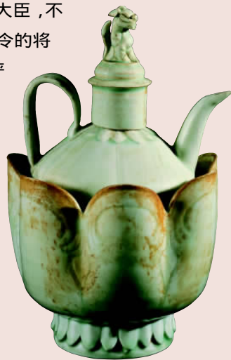
影青刻花注子注碗 宋 这是一组制工精美的酒具。下面是用于温酒的注碗，上面是盛酒的注子，置于注碗内，盖顶塑一蹲狮。造型美观，釉色素雅，是宋代酒具中的精品。

日”，指称这是天命授受的预兆。晚上，大军屯驻陈桥驿（今河南封丘东南陈桥镇）。赵匡胤的亲信将校聚集谋划，大家认为：“当今天子年幼无知，我们拼死拼活作战，有谁知道我们的功劳？倒不如现在就拥护点检作皇帝，然后北征也不晚。”赵匡胤的弟弟赵匡义和亲信谋士赵普假意出来劝阻，一面叮嘱大家一定要安定军心，不要造成混乱；一面却连夜派人驰返京城，让留守的大将石守信、王审琦做好内应，伺机待变。于是，整个军营便沸腾起来，全军将士都拥到赵匡胤住处外面，一直等到天色发白。第二天天刚亮，部分将士顶盔贯甲、手握兵刃，直奔屋内。赵匡义连忙叫醒喝醉了的哥哥，将士振臂高呼：“大军无主，愿立点检为天子！”没等赵匡胤答复，有人已经把早已准备好的黄袍披在他身上。大家跪拜磕头，山呼万岁，并将他扶上马，请他回京主持大局。赵匡胤还装出一副被迫的样子说：“你们自己贪图富贵，想要立我为天子。如果能够听从我的命令，我就答应你们的要求；不然，我不能做你们的天子。”拥立者一齐表示惟点检之命是听。赵匡胤在马上当众高声宣布：“回京城之后，你们要保护好周朝的太后和幼主，不许凌辱朝廷大臣，不许抢掠国家仓库。执行命令的将来必有重赏，否则就要严惩不贷！”