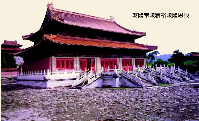
乾隆帝陵寝裕陵隆恩殿