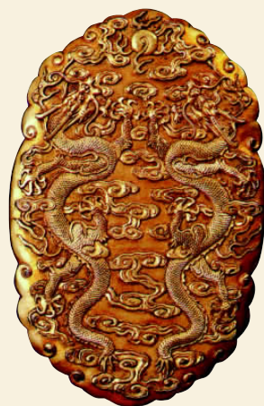
龙纹铜合符 清 合符为皇宫和都城夜间特殊的放行证件,由阴阳两片组成。合符表面有二龙戏珠的图案,周围饰以祥云。