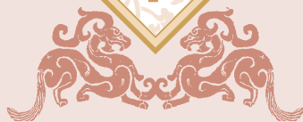
图 说 天 下