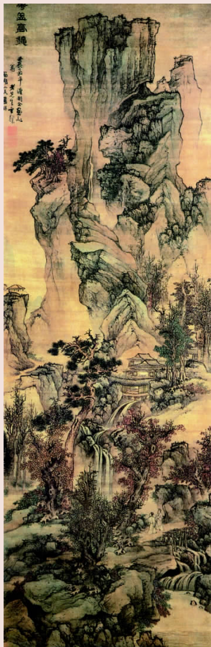
华岳高秋图 明 蓝瑛

明朝统治者把李贽的学说看做是“异端之尤”、“非圣无法”的洪水猛兽,加以销毁。万历三十年(1602),礼部给事中张问达秉承首辅沈一贯的旨意上奏神宗说:“李贽壮岁为官,晚年削发,近又刻《藏书》、《焚书》、《卓吾大德》等书流行海内,惑乱人心”,“以秦始皇为千古一帝,以孔子之是非为不足据,狂诞悖戾,未易枚举”。神宗以“敢倡乱道,惑世诬民”的莫须有罪名在通州逮捕李贽,并焚毁他的著作。李贽在狱中说:“衰病老朽,死得甚奇,真得死所矣。如何不死?”三月十五日,李贽在镇抚司的狱中用剃刀自杀,结束了他76岁的生命,锦衣卫写给皇帝的报告则称李贽“不食而死”。