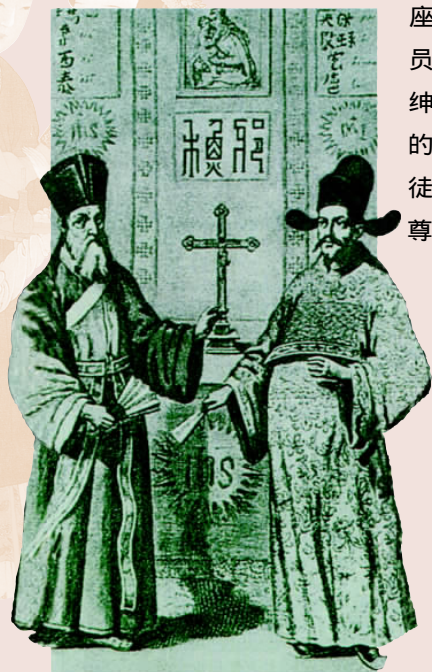
利玛窦与徐光启画像

万历二十九年十二月（1601年初），利玛窦在一些地方官员的帮助下来到北京，向明神宗朱翊钧进献