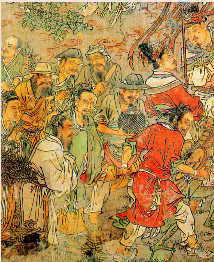
捕蝗图 明 壁画

葛成进监狱那天,成千上万的苏州市民来为他送行。葛成进了监狱,又有络绎不绝的市民带着酒饭、衣服来慰问。葛成本被判处死刑,但明政府见他如此受民众拥戴,恐怕众怒难犯,一直没敢执行。关押了12年后,葛成终于被释放。