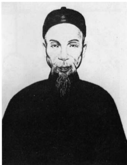
孙中山的父亲孙达成