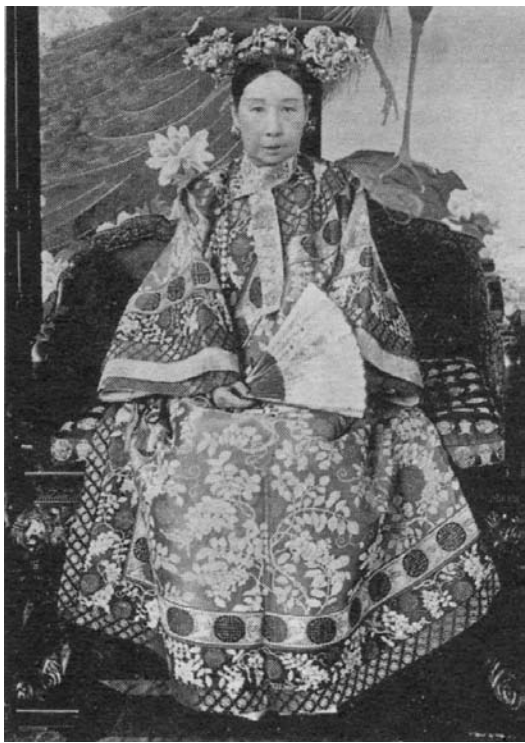
西太后慈禧掌握着朝廷实权