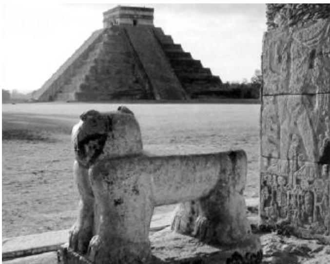
位于墨西哥的一处古玛雅人金字塔

石头的电钻要快 500 倍? 巨石之间堆砌得极为紧密,连最薄的刀片都插不进去。帝华纳科遗址的新发现揭示了这些建造技法的高超之处:他们把相邻的巨石之间凿出凹槽,倒入熔化的金属,金属凝固后,就把相邻的巨石牢牢地连在一起了。这需要一个移动自如的冶金车