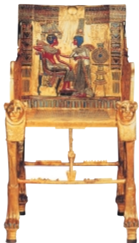
埃及国王的黄金宝座

国家的重新统一，使埃及的社会经济得以发展，水利灌溉系统得到进一步发展，开拓了许多新的良田。手工业方面，青铜器的使用更为普遍。最引人注目的事件，当属沟通地中海与红海之间地峡的开凿，这一运河是苏伊士运河的前身，但比后者早了3700多年。埃及商船从此便可从