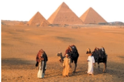
吉萨高原上的胡夫、哈佛拉、孟卡拉三座金字塔

古王国时期开始修建金字塔，而且最大的胡夫金字塔也建于此时，故古王国时期亦称金字塔时期。金字塔是古代埃及法老的坟墓，因其形状很像中国的汉字“金”字，所以中国人称之为“金字塔”。在尼罗河下游的平原上，矗立着许多高大的金字塔，其中最大的一座是法老胡夫的金字