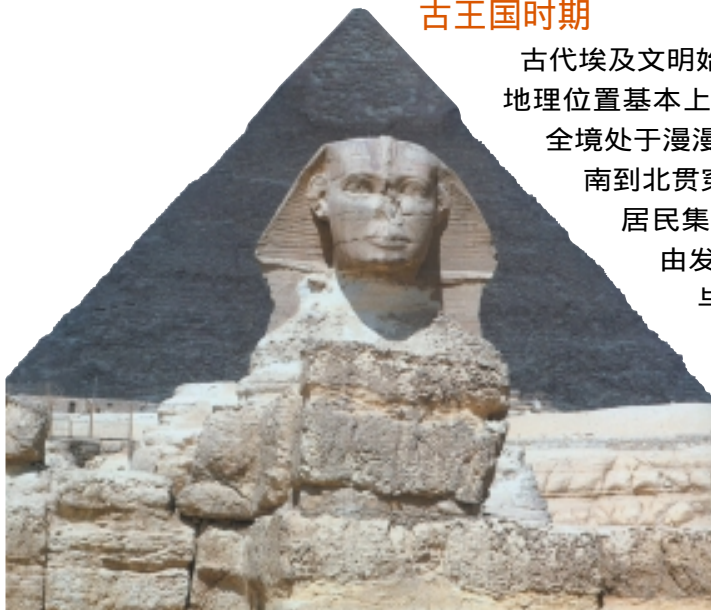
金字塔及狮身人面像

古代埃及文明始于公元前4000年左右，其地理位置基本上相当于今日的埃及。埃及全境处于漫漫黄沙之中，只有尼罗河从南到北贯穿其间，埃及大约有95%的居民集中在尼罗河两岸。尼罗河由发源于非洲中部的白尼罗河与发源于苏丹的青尼罗河汇合而成，途中流经森林和草原地带，富含丰富的腐殖质，每年7月至11月定期泛滥，在河岸两侧沉积成肥沃的黑土地。尼罗河这种少有的特点，使尼罗河谷成为埃及的粮仓，所以古人说：“埃及是尼罗河的赠礼。”