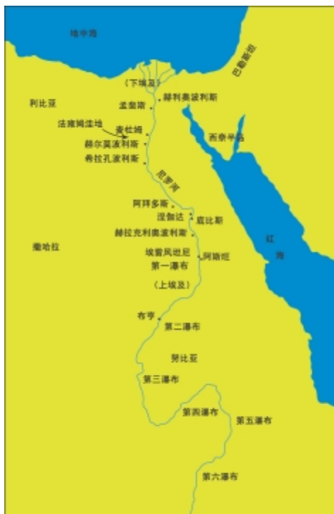
尼罗河流域位置图