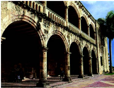
📍 圣玛丽亚·拉梅诺尔大教堂