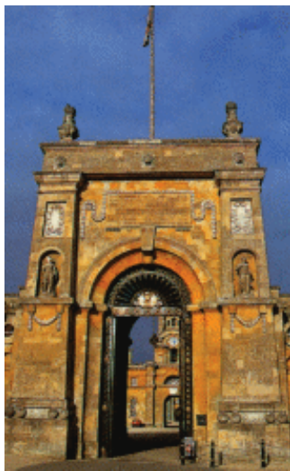
布莱尼姆宫的东门

宫。此外，这个宫殿的建筑也吸收了意大利建筑的部分因素。浪漫主义是布莱尼姆的主要风格特征。