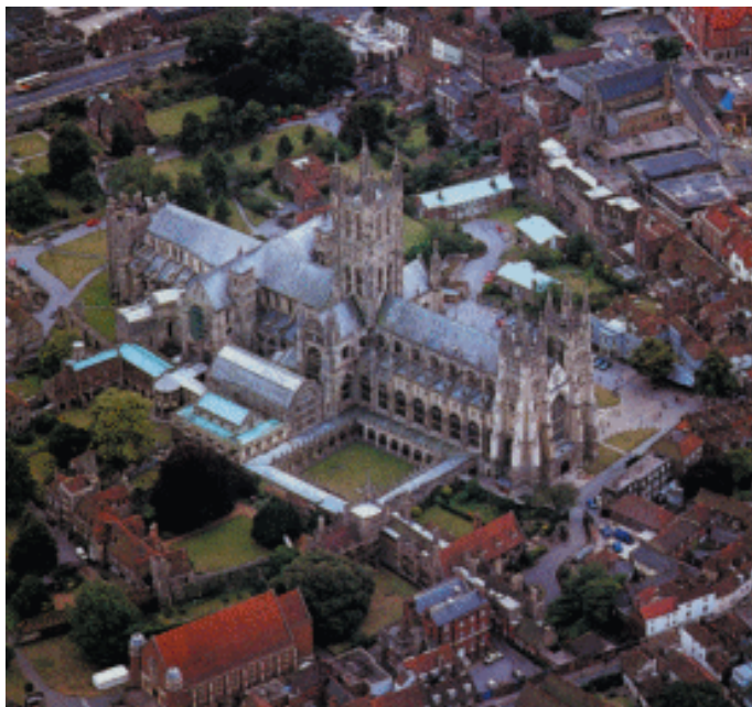
从空中俯视坎特伯雷大教堂

由回廊、会议厅、寓所、教堂、食堂、医院等建筑组成,建筑庞大,可以供150名修道士修行。这个修道院后又于公元7~8世纪成为神学中心。11世纪,修道院内又建造了一座连接修道院教堂和圣玛利亚教堂的圆殿,并修建了一座用来安葬坎特伯雷的几位大主教的新教堂。