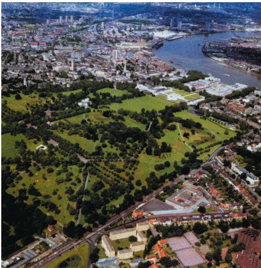
格林威治海岸地区景观