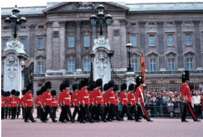
白金汉宫前禁卫军交接仪式

典仪厅、会客厅、舞厅、音乐厅、画廊、图书室、集邮室等厅室较为重要。这些厅室都饰以光彩夺目的冰晶玻璃和雕花玻璃的大吊灯，还设置了金碧辉煌的天花板，铺着高级豪华的地毯，其家具和陈设品都是稀世