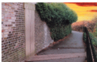
通过格林威治天文台的本初子午线

英国摄政王汉弗莱于 15 世纪初在这里建了一座用来窥视进入伦敦的船只的瞭望塔。1675 年，当时在位的英王查理二世将瞭望塔改建成英国皇家格林威治天文台。1884 年，国际天文工作者决