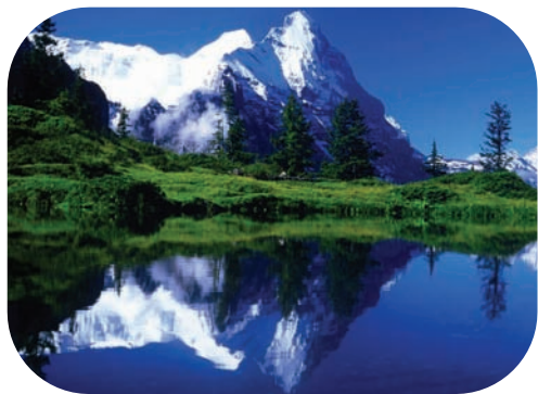
▶阿尔卑斯山下美丽的湖泊景色

阿尔卑斯山地域有着丰富的动植物资源。由于气候的影响，阿尔卑斯山脉的植被呈明显的垂直变化。可分为亚热带常绿硬叶林带（山脉南坡800米以下）；森林带（800~1800米），下部是混交林，上部是针叶林；森林带以上为高山