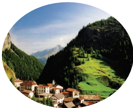
▶阿尔卑斯山美丽的植被

西阿尔卑斯山是这种推覆体构造的典型。古代的阿尔卑斯山脉是欧洲最大的山地冰川中心。山区覆盖着厚达1千米的冰盖，冰蚀地貌尤为典型。许多山峰角峰锐利，峻峭挺拔，只有少数高峰突出冰面构成岛状山峰，并有许多冰川侵蚀作用形成的冰蚀崖、角峰、冰斗、悬谷、冰蚀湖，以及冰川堆积作用的冰碛地貌。还有1200多条现代冰川，总面积约4000平方千米。中阿尔卑斯山麓中瑞士西南的阿莱奇冰川最大，长约22.5千米，面积约130平方千米。山地冰