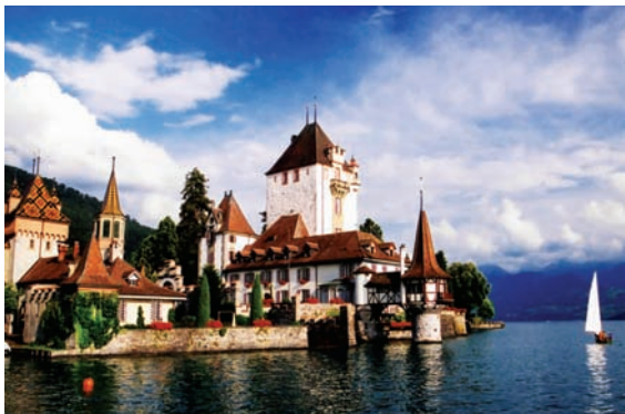
▲阿尔卑斯山下宁静而浪漫的村镇

阿尔卑斯山脉山区的交通很发达，自古以来就是南北交通的要道。1871年，在法国和意大利之间的塞尼山开凿了第一条铁路隧道，以后又建成多条。1905年建成的瑞士和意大利间的辛普朗隧道，长19.82千米，是世界上最长的隧道之一。勃朗峰下的公路隧道，长11.6千米。1980年建成的圣哥达隧道，长16.3千米，是世界上最长的公路隧道。