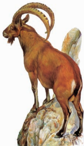
▶矫健的阿尔卑斯大角山羊

在这一地区，常有焚风出现，引起冰雪迅速融化或雪崩而造成灾害。但也正因为如此，阿尔卑斯山脉是欧洲许多河流的发源地和分水岭。多瑙河、莱茵河、波河、罗纳河都发源于此。山地河流上游，水流湍急，水力资源丰富，有利于发电。