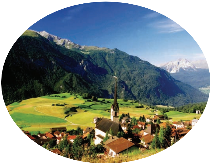
▲阿尔卑斯山下浪漫的小镇风光

瑰丽的阿尔卑斯山脉是欧洲南部最高大的山脉，它西起法国尼斯附近的地中海海岸，向北、东呈弧形延伸，经意大利北部、瑞士南部、列支敦士登、德国南部，东至奥地利的维也纳盆地。宽120~200千米，绵