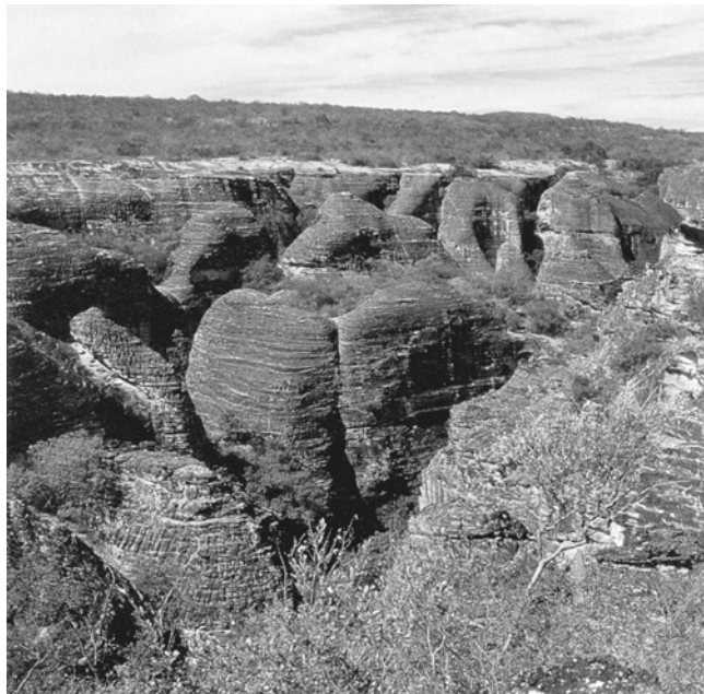
卡皮瓦拉山奇特的地貌

道狭窄、密集，路面上有着各种图案花纹，是用黑色和白色的石子铺砌成的。下城处于港口附近的莫德罗市场，这里贩卖奴隶的活动一度盛行，如今是手工艺品市场，非常热闹繁华。76座教堂分布在市区中，它们有的是造型挺秀、线条明快的哥特式风格的大教堂；有的是巴洛克式风格的教堂，这种教堂豪华富丽，线条起伏，富有动感。其中圣弗兰西斯科·德阿西斯教堂成了宗教美术馆，馆里陈列着许多历史文物，其中有许多天主教艺术品。3000多座古建筑分布在萨尔瓦多古城的佩洛尼奥区、圣安东尼奥区和索德雷区。其中佩洛尼奥区最能反映古城风貌，它是拉美的欧洲殖民统治时期修建的最大建筑群，不少建筑带有葡萄牙古老的建筑风格。