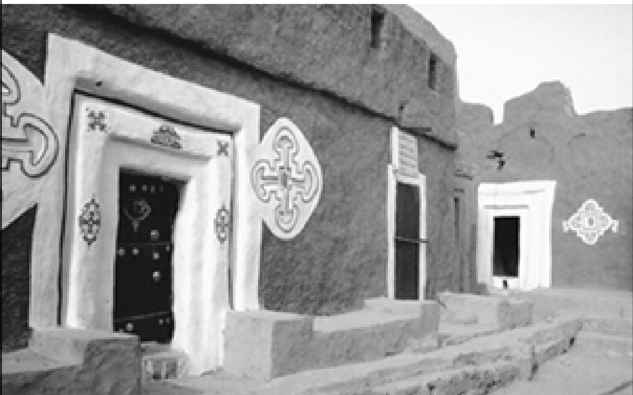
▼ 古代商路上装饰精美的旅馆

堂，礼拜堂的穹顶由一根根粗大的柱子支撑着。石块、黏土和木材是最主要的建筑材料，门口有石刻装饰。