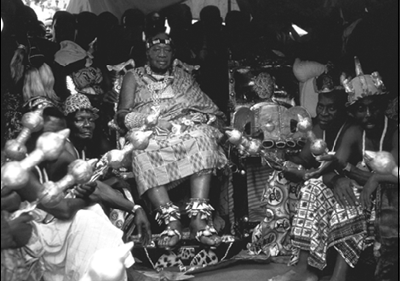
▲ 阿散蒂身着传统服饰的加纳人