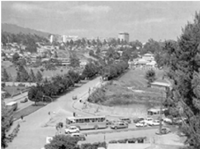
▼ 埃塞俄比亚首都亚的斯亚贝巴市景

大厦里陈列着各种具非洲各国特点的工艺品，供来宾们观赏。大厦前是一个公园，参加非洲独立国家首脑会议的元首们曾亲手在公园种植了松柏树。大厦对面的一幅大型壁画上描绘了非洲人民团结反帝的情景，壁画旁边还有画着各国首脑头像的油画。