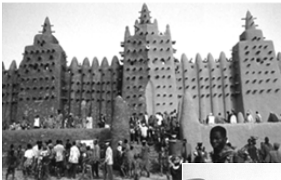
▲ 粉饰杰内大清真寺

杰内古城的民居仿佛是一块块切割整齐的大石块。泥沙涂抹着院墙，院子中央是公共场所，惟一的出口是一个木制大门，用粗大的铁钉作装饰物。