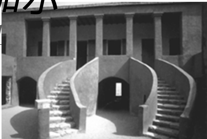
▲ 戈雷岛上的奴隶堡