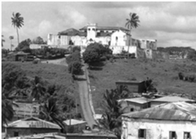
▶ 加纳贝亚河口的埃尔米纳堡

黄金贸易在18世纪衰落下去后，取而代之的是奴隶贸易。奴隶贸易在19世纪被废除后，贩卖黑奴的罪恶行为并