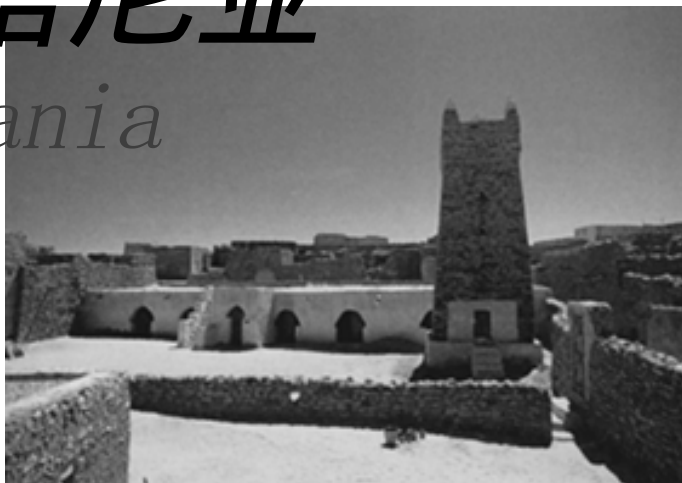
▲ 衰落荒废的沙漠商队古城

到毛里塔尼亚旅游主要是进行沙漠访古，瓦丹、瓦拉塔等古代商队城市对游客颇具吸引力。