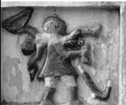
◀ 阿波美王宫墙壁装饰

阿波美博物馆是在阿波美历代王宫的基础上改建而成的，它充分反映了贝宁劳动人民的智慧和勇气，展示了贝宁劳动人民创造的优秀文化艺术；为了抵抗外侵，他们又进行了艰苦卓绝的斗争。从中人们可了解贝宁的过去，洞悉今天并展望美好的未来。阿波美博物馆吸引着众多游客。