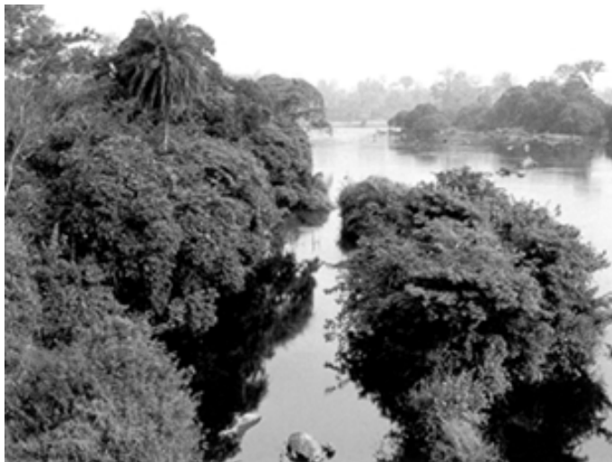
▼ 塔伊国家公园景观之一

1926年这里建立了莫耶一卡瓦利森林保护区，占地9600平方千米。1933年改为物种专门保护区，除涅诺科埃山地区外，都不允许人们游览观光。1970年，这里变成了国家公园。得益于一系列保护措施，目前塔伊国家公园仅有极小的一部分地区受到人类活动的影响，这里保存着的热带原始森林区是地球上为数不多、面积较大的一个。