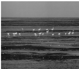
▲ 阿尔金岩礁公园里的鸟类

阿尔金岩礁国家公园，坐落在毛里塔尼亚西部。它位于大西洋岸边，由沙丘、小岛、沿海沼泽地和浅滩组成。在这里能欣赏光怪陆离的海洋景观，又能望见茫茫大漠。公园内动植物资源丰富。冬季，有许多候鸟来此过冬。品种繁多的海龟和海豚就生活在附近的海域中。