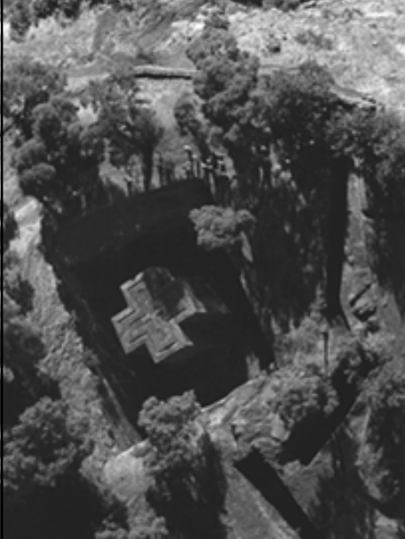
▲ 俯视圣·乔治独石教堂

石柱形走廊、镂空透雕的门窗以及纹饰、塑像、浮雕和祭坛等。各个教堂之间有和岩洞相连的地下通道。所有教堂均未用任何粘土粘合剂或灰浆。