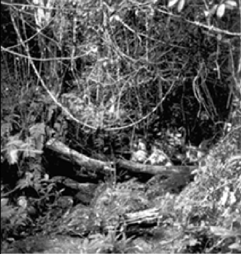
▲ 塔伊国家公园景观之二

由于气候条件的限制，塔伊国家公园内生长的森林有两类：一类主要由单性大果柏构成，另一类由柿树构成。这里是多种地方性植物的巨大宝库。被认为早已不存在的植物往往能在这里重新被发现，如仅于19世纪在喀麦隆发现过一例的紫穗槐。