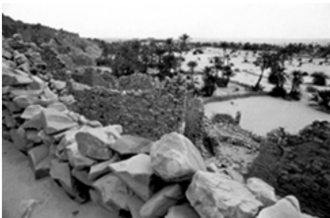
▲ 沙漠商路上的瓦丹古城

瓦拉塔地处提希特东南，曾一度繁荣。15世纪时，因大批知识分子到此，它成为文化中心。后来由于阿拉伯人入侵和商路改道，瓦拉塔辉煌不再。