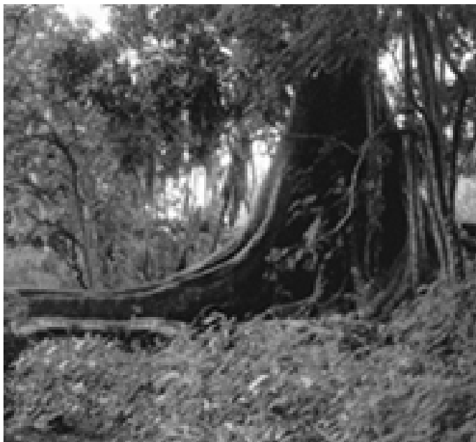
▼ 科莫埃国家公园里茂密的森林

科莫埃自然保护区正好处于热带稀树草原向热带雨林过渡的地带，动植物种类繁多，南方植物是此园的一大亮点。科莫埃河两岸是茂