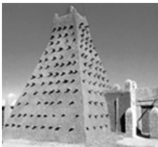
▲ 廷巴克图穆萨清真寺宣礼塔