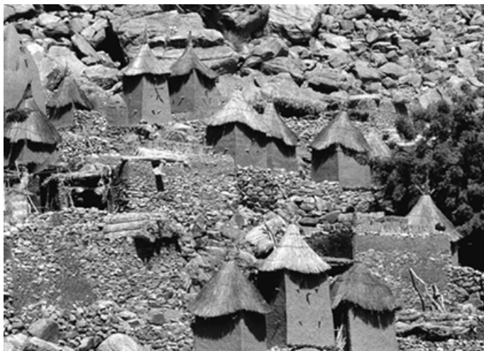
▼ 悬崖下的多贡人民居