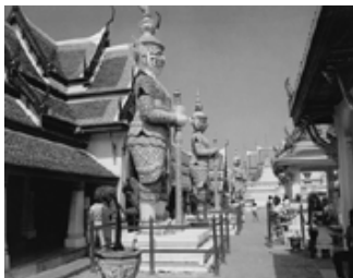
大王宫玉佛寺寺院守护神塑像群

呈三角形，分三层相叠，层层低垂，远望只见一片绿色和金黄色鱼鳞状琉璃瓦拼成长方形图案的殿顶，是泰国早期建筑式样的典型代表。