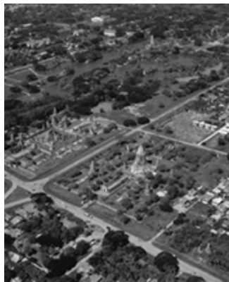
大城历史名城遗址全景

古城内那金碧辉煌的庄甲盛宫，如今已是阿瑜陀耶博物馆。耶佳曼克寺，是一座三角形的斜塔，创建于1357年，规模宏伟，雕饰精美，不失为一处引人入胜的游览胜地。帕蒙空母大佛，是迄今为止泰国最大的金属佛像之一，位于挽巴茵宫东墙