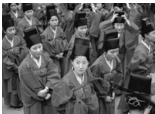
身着儒家服饰的人们去参加祭礼