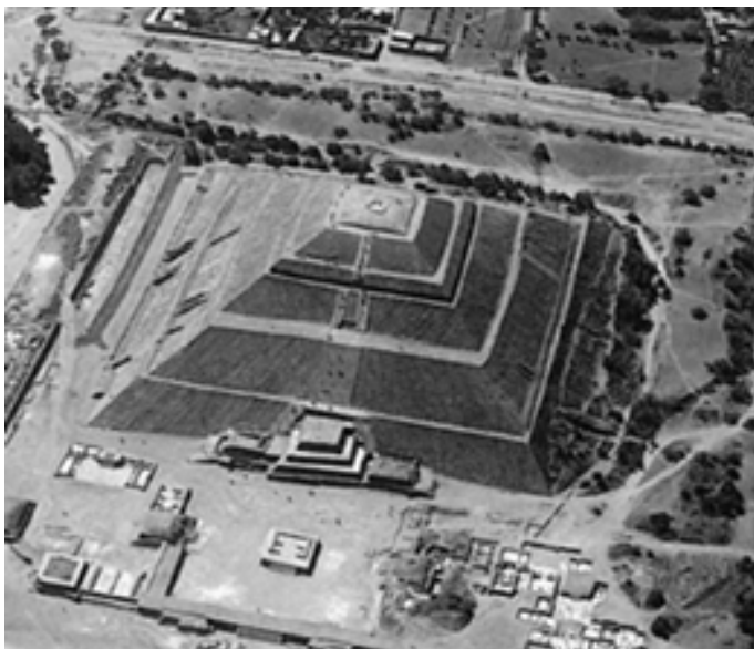
▲ 俯视太阳神金字塔

米，是当时祭祀月亮神的圣殿。当时全城最华丽的建筑是呈方形的蝶鸟宫，每边长440米，宫内有4座金字塔形神庙。在宫内方柱上，还刻有栩栩如生的蝶翅鸟身像，这些浮雕充分展示了匠师高超的艺术水平。