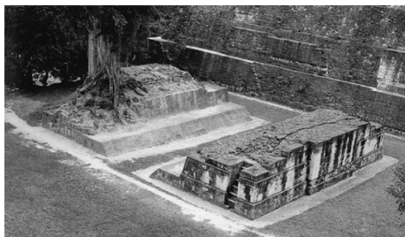
▲ 蒂卡尔古城遗址中的祭坛

蒂卡尔在公元前 9 世纪 ~ 前 3 世纪开始形成村落。公元前 3 世纪 ~ 公元 3 世纪，这里被玛雅人当成重要的祭祀中心；到了公元 3 世纪 ~ 9 世纪，蒂卡尔趋于繁荣。这个时期，蒂卡尔的城市建筑迅速发展，金字塔、宫殿、神庙、广场等规模宏大的建筑物相继建成，这一时