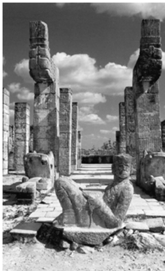
▲ 奇琴伊察古城的五十武士神殿入口处

库库尔坎金字塔和塔顶上的羽蛇神庙是这个古城遗址中最大的建筑。高30米的库库尔坎金字塔共9层，底座呈正方形；金字塔下宽上窄，呈阶梯形。塔的四周各