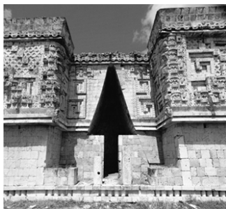
▲ 乌斯马尔古城总督宫(局部)

雄伟的乌斯马尔古城南北长约1000米，东西长约600米，它继承了玛雅文化的传统，于宏伟壮观中又富有变化。在一条南北方向的中轴线上，设置了城市中最重要建筑，再从南向北，依次建造了南神殿、鸽子宫，以及一个由四座建筑围成的广场等建筑，在鸽子宫东面，修建了一个大金字塔，其东北