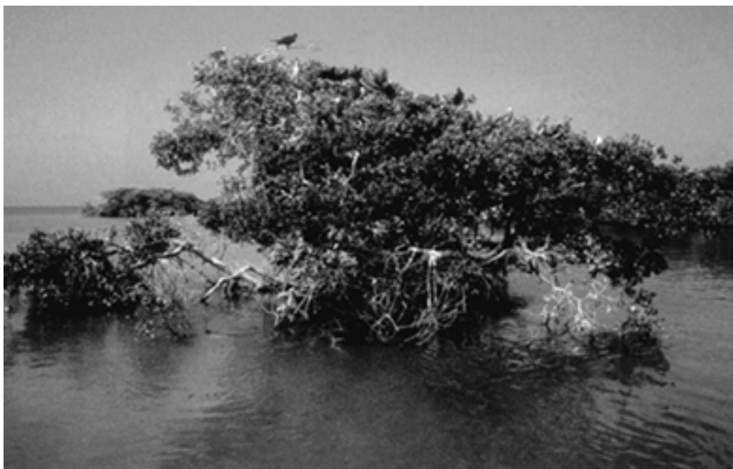
▲ 锡安卡恩生物保护区内的小岛

雁越冬的最佳场所。栖息在红树上的黑雁与红树林形成了鲜明而和谐的色彩对比。同时，这里还是鹿、叉角羚、大角羚、狐狸等野生动物的栖息之地。