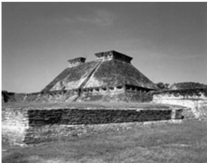
▲ 埃尔塔欣古城南球场遗址

据考察,这一地区原有数百座金字塔,但这些金字塔已大部分被土层或野草所覆盖起来,只有壁龛金字塔较为完整地保存下来,也是墨西哥所发现的金字塔中最独特的一座。约建于公元5世纪的壁龛金字塔属于托托纳克文化,塔高24米,塔底部为每边长36米的正方形,全塔共镶嵌着365个方形壁龛,365个壁龛代表着一年365天。每一层还有一个向外伸出的檐口,使这座金字塔在光线和阴影的反差中显得更加庄严、肃穆。