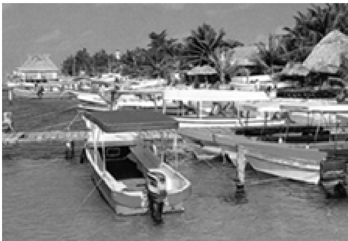
▲ 坎昆附近岛屿的港湾内，停泊着的游船船队。

总长21千米的坎昆岛的最宽的地方仅400米，面积约60平方千米，狭长的地形使它宛如一条飘荡在浩瀚的海中的长带。20公里长的白沙滩上，由珊瑚风化而成的细沙柔如毡、白如玉，因而，在不同的地段，人们分别称其为“白沙滩”、“珍珠滩”、“海龟滩”、“龙虾滩”等。海滩上设有玛雅式凉亭