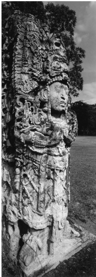
▲ 科藩的玉米神石雕

用整块山岩雕凿而成的宗教石碑群高低不一,上面刻满了图案,这些图案都各有其象征意义,碑上还刻了数以千计记载了玛雅人的重