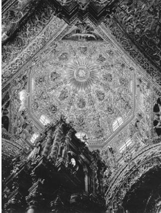
▲ 普埃布拉城博物馆内景

治时期，在城内的中央广场上屹立着建于16世纪的双塔式钟楼并立的天主教堂。站在教堂的顶楼上，可把全城景色以及东北方带有雪冠的火山尽收眼底。教堂内地面上铺以大理石，四周围墙以木雕和金叶作装饰，在其门框上还饰以石雕图案。一位被海盗劫持到墨西哥的中国公主被葬于耶稣会教堂内，并在教堂圣器室内悬挂着的一块匾。匾上将其曲折的经历及与当地人民建立亲密友谊的史实详细记载下来。城中建有一座博物馆，收藏着美洲殖民时期最早的整幅壁画。