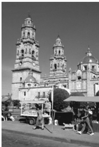
▲ 莫雷利亚市中央广场附近的教堂

在墨西哥境内西班牙殖民城市中，莫雷利亚是最古老的一个，城中保留着许多壮观的建筑，都属于巴洛克风格或文艺复兴风格。其中，巴洛克大教堂是城中最重要的纪念性建筑。这座教堂规模宏伟，建造时，用了100多年的时间。大教堂的外形非常壮观，其内部装饰是新古典样式，极尽华美，而尤以纯银的洗礼盘和1903年德国制造的风琴引人注目，教堂