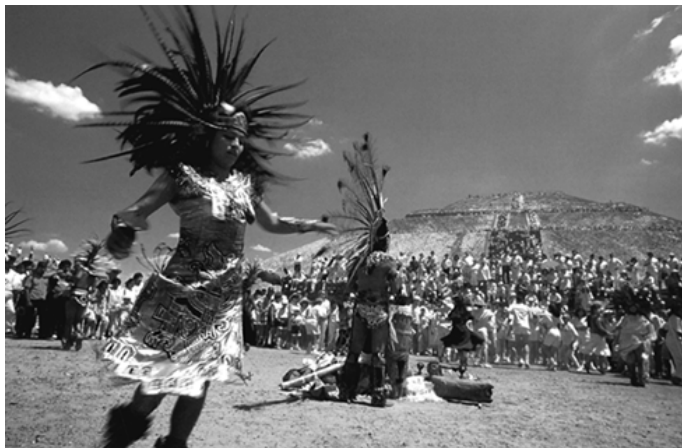
▲ 在金字塔前表演传统舞蹈的印第安人