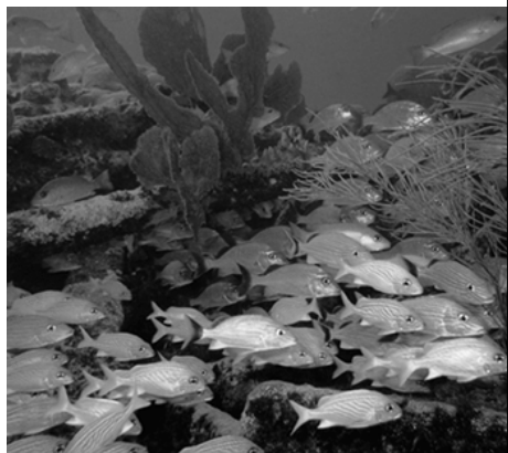
▲ 锡安卡恩生物保护区内的海底鱼类

玛雅人的一支部落于公元 5 世纪从中美洲来到这里，并在这里创造了灿烂的玛雅文化。因而，在保护区内，至今还有大量古典期和