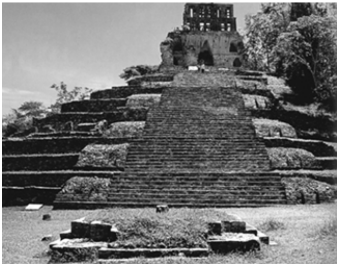
▲ 帕伦克古城遗址中的金字塔

主要建筑包括中殿和门廊等。在其主体建筑的后面有共刻着 617 个玛雅象形文字的石碑三座。