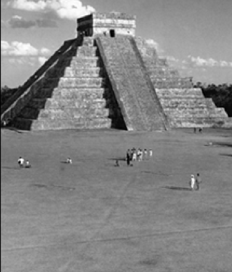
▲ 奇琴伊察雄伟的金字塔

有91级石阶，石阶总数加上顶层共365级，代表一年365天，另外两个1米多宽的边墙分别位于台阶两侧。北侧台阶两道边墙下端雕刻着一个高1.43米、长1.87米、宽1.07米的带羽毛的蛇头，形象逼真、工艺精湛。这座金字塔在每年春分和秋分这两天的下午都会出现奇异的蛇影。这一奇异的景象是经过古玛雅人巧妙设计和精确地计算而产生的，其中的复杂奥妙令人赞不绝口。