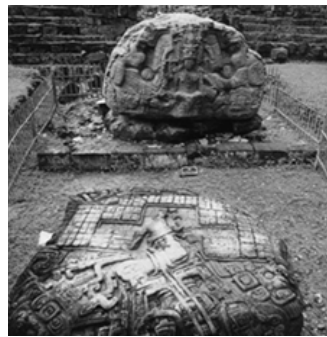
▲ 基里瓜遗址中有玛雅文明最大的石碑

被毁了。但是，记录着玛雅社会的政治和经济的历史的石碑还遗存下来，上面的浮雕、象形文字及所刻的日期和数据都是研究玛雅文化的珍贵资料，其中建于公元692年的石碑历史最为悠久，最高的石碑有10.6米，距今年代最近的一块石碑上雕刻着第一代国王卡瓦库·斯卡伊的身像，非常精致。