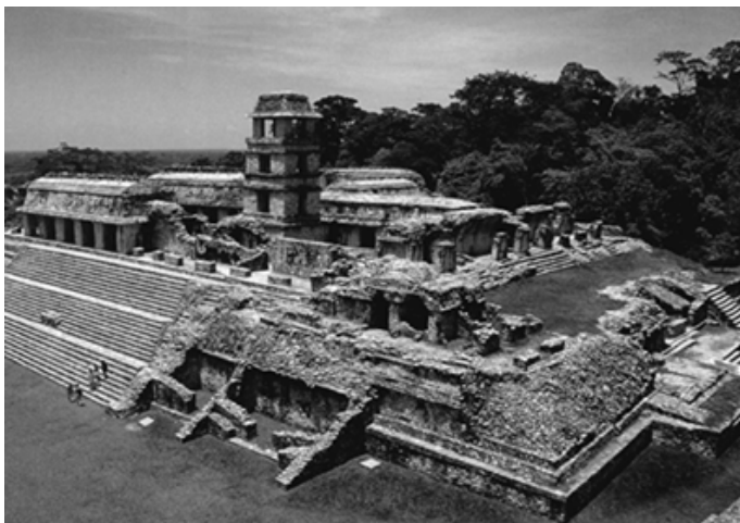
▲ 帕伦克古城遗址中的四层塔楼建筑群

金字塔形，其外形仿太阳神庙建筑形式，在其石柱、墙裙及屋脊上均以灰泥浮雕作装饰，整个神庙宏伟典雅。