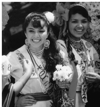
▲ 风姿绰约的墨西哥少女

位于霍奇米尔科湖畔的霍奇米尔科由一片与外界隔绝的土地和湖田构成，深具西班牙风格的霍奇米尔科建筑布局分为一个中心广场和17个区，另外，还有许多教堂和寺院分布在每个区内。