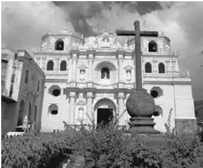
▲ 安提瓜危地马拉的教堂

位于危地马拉东北部的伊萨巴尔省的基里瓜考古公园和玛雅文化遗址，距首都危地马拉东北约160千米。