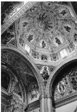
▲ 圣托多明各大教堂内华丽的装饰