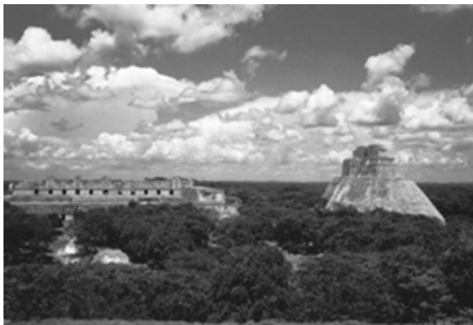
▲ 丛林中的乌斯马尔古城

角,建有乌龟宫,而球场、祭司住所和魔术师金字塔则被建在宫的北面。底面呈椭圆形的魔术师金字塔包括有5座神殿,这个金字塔的椭圆形底面长径70米,短径50米,塔高达26米,其边缘呈圆弧状。金字塔的建设工程浩大,从公元6世纪开始动工,历时几百年,到11世纪时才结束。在建设过程中,各个时期不同风格的建筑艺术被完美地融合在一起。