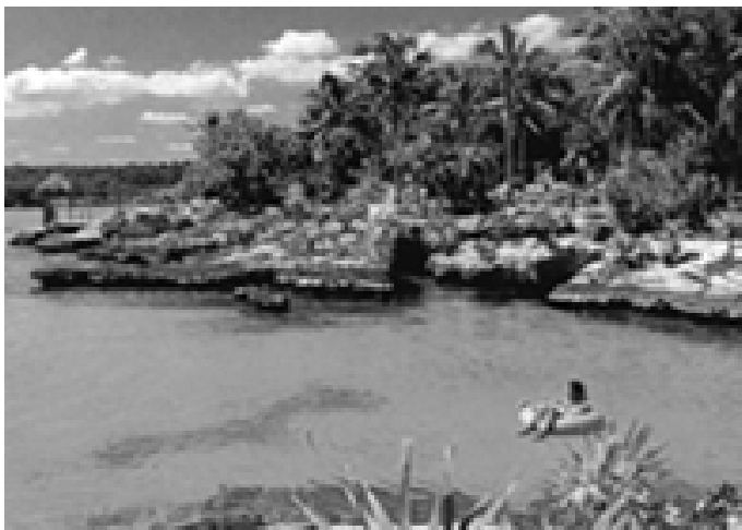
▲ 在坎昆海湾享受美好风光的度假者

中分布着众多小岛，有与陆地相连的半岛，也有如星般撒在湖中的小岛。这种岛外有湖、湖外有岛、岛套岛、湖连湖的地理结构形成了一种独特风光，吸引了大批游人前去览胜。同时，这里也极适宜于进行垂钓、潜水、滑冰等水上运动。