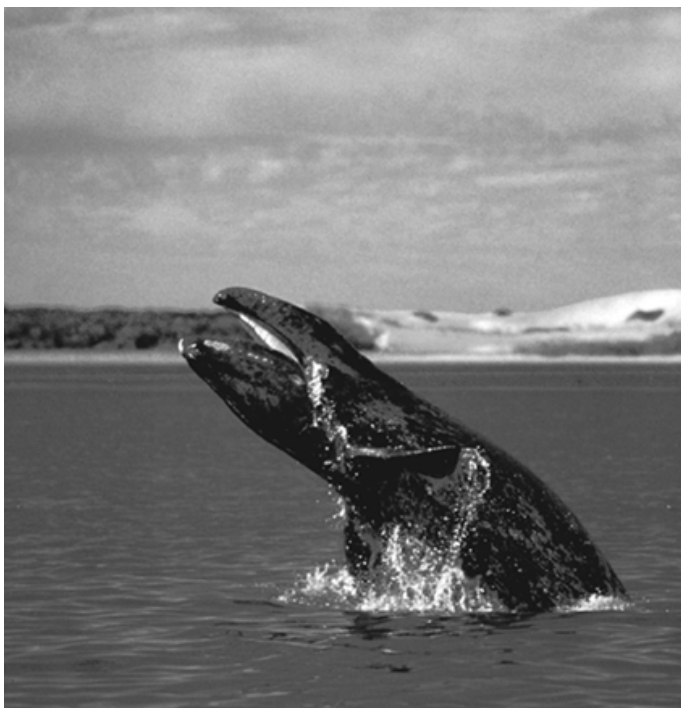
▲ 比兹卡依诺湾里的黑鲸跃水