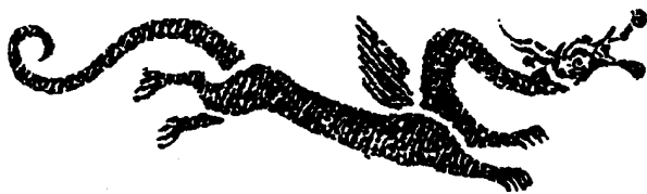
河南南阳汉画像石：矫健长（cháng）尾的应龙，长（zhǎng）着翅膀，神气灵动，一副一往无前的样子。

这是一篇龙的赞美辞，赞龙之大（“元”），赞龙之神，赞龙之好（“丽”），如此修饰语已经鲜明地亮出了作者夸奖的态度了，何况铭辞的颂扬：你是一条美好的神龙呵，一诞生就充满了阳刚之气，有时候你潜伏在水的底层，然而鼓动双翅就飞跃到了天庭！你是一条根据客观情势能屈能伸的神龙呵，变幻无穷，可以在污泥里打滚，可以在太空里飞腾！铭辞已经把龙说得极其神奇、神异、神灵、神圣了，后人又变本加厉，说龙能无能有、能大能小、能潜能见、能微能彰……中国人爱龙喜龙好龙崇龙之情，是一以贯之的，是延绵不绝的。