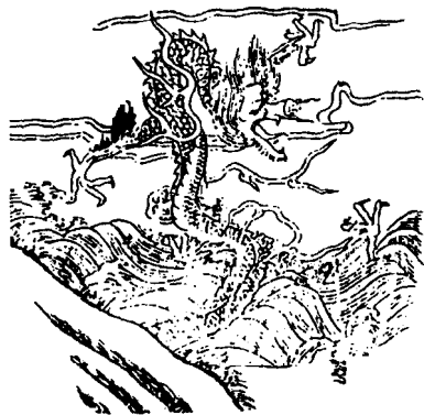
明代《三才图会》蛟龙图：山峦流水之间，一系蛟龙竖起半个身子，张牙舞爪，成风凛凛。