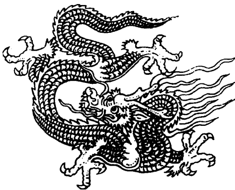
山西大同明代九龙壁上的龙图案：传说龙无故有“聋”字，可是这条龙却长着如牛的耳朵。

建筑最为驰名的是山西大同和北京的北海与故宫三座九龙壁。其中以建于明代初年的大同九龙壁规模最大，长45.5米，高8米，厚2.02米，壁身由426块特制琉璃构件拼砌而成，壁上波涛汹涌，九条色彩斑斓、形态各异的巨龙——生气勃勃，壁前有映壁池，龙影倒映池中，似乎要跃出瀚海，奔腾上天。北海九龙壁两面都有九龙戏珠的雕饰，