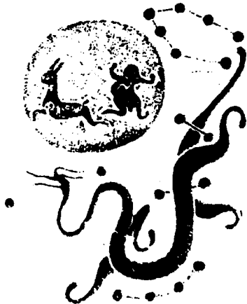
河南南阳汉画像石：东宫星宿犹如一条蜿蜒的龙，龙的上方一轮满月，月中有玉兔和蟾蜍。

——乌云密布，突然一道闪电，接着雷鸣，大雨滂沱，于是激发了先民的幻想，认为那是龙在播雨，