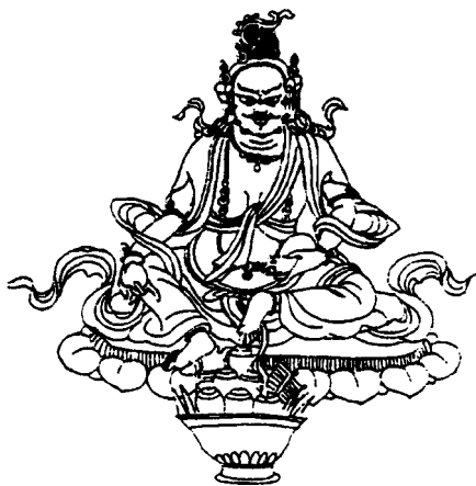
手托鼠鼯之黄布禄金刚（黄财神）

象征我国有些地区把鼠称为财神爷，家有老鼠是富足的象征。为什么呢？过去大多数农民，家徒四壁，无隔宿之