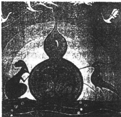
拉枯族创世史诗《牡帕蜜帕》

清代刘献廷（1648 ~ 1695）在《广阳杂记》里说：“天开于子，不耗则其气不开。鼠，耗虫也。于是夜尚未央，正鼠得令之候，故子